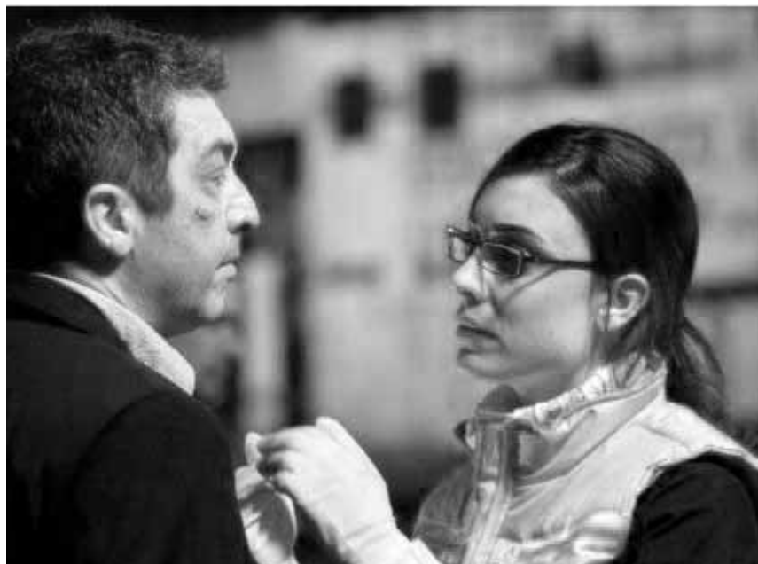
Des rencontres peuvent changer la vie, ainsi que dans „Carancho“ au Le Paris et au Kursaal.

✘ Une comédie drôle, malgré les clichés qui peinent à être dépassés. (lc)