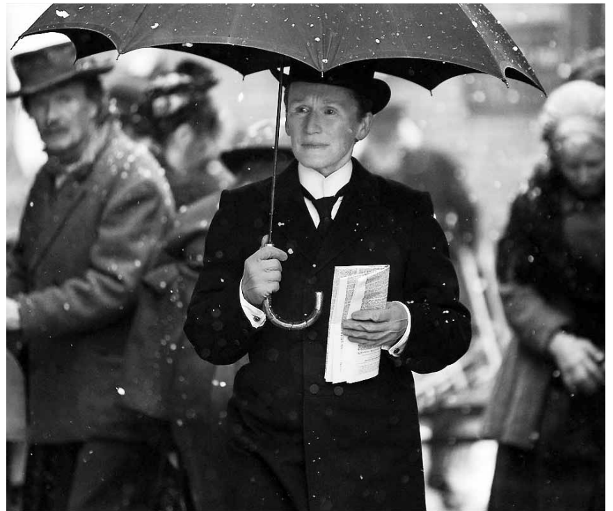
Im 19. Jahrhundert hatten es Frauen manchmal einfacher in Männerkleidern, „Albert Nobbs“ neu im Utopia.