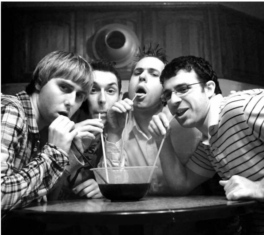
Freuden und Nöte zwischen Jung- und Erwachsensein. „The Inbetweeners“, neu im Utopolis.