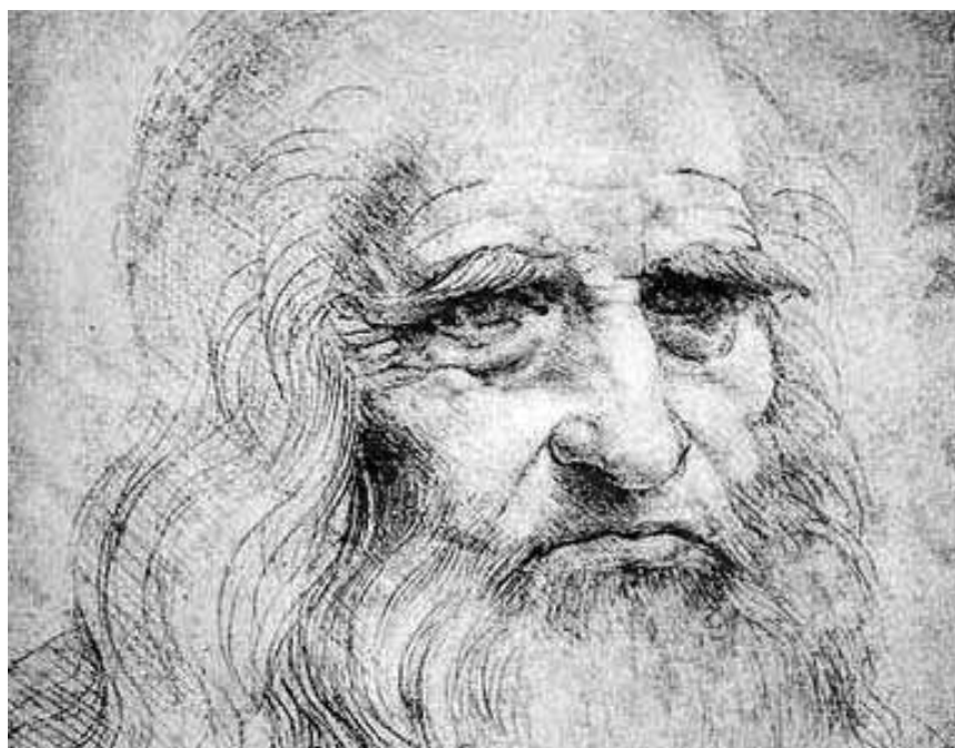
Ob „Dame mit dem Hermelin“ oder „Madonna in der Felsengrotte“, die Ausstellung „Leonardo da Vinci: Maler am Mailänder Hof“ in der National Gallery in London ist live auf der Kinoleinwand zu erleben. Donnerstag, im Utopia und Starlight.