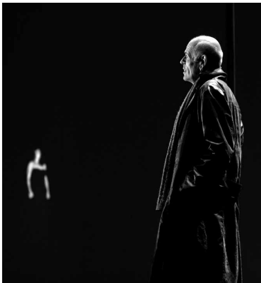
« L'opéra du pauvre » de Léo Ferré met en scène la Nuit traînée au tribunal pour le meurtre de Dame Ombre. A découvrir au Grand Théâtre le 10 et 11 février.

The Convertibles, Brasserie L'Inoui, Redange , 20h. Tél. 26 62 02 31.