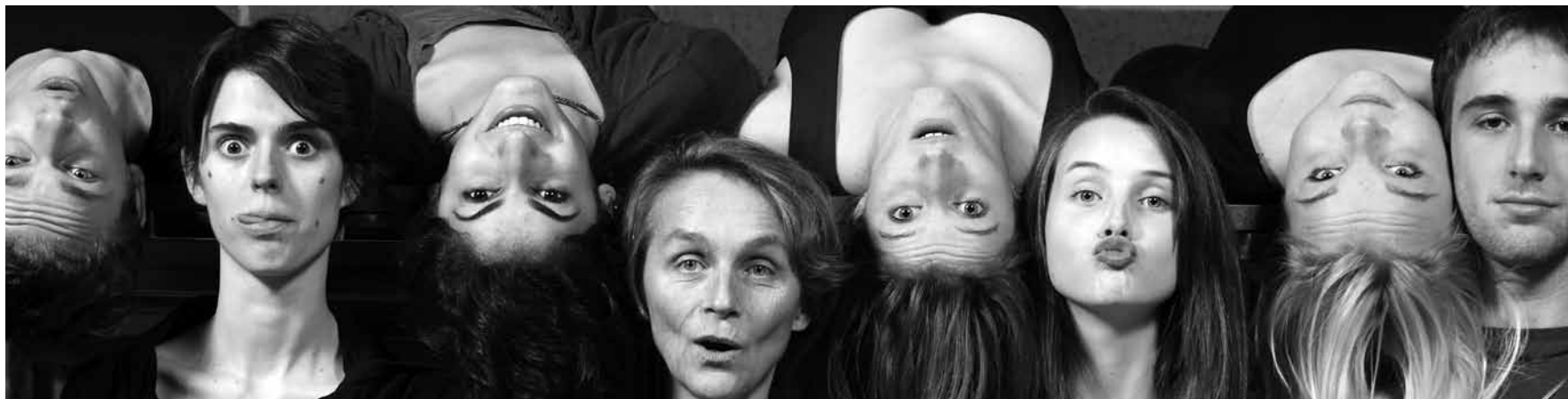
Auszüge aus Stücken von Marivaux, Shaw, Brecht, Wilder, Giraudoux, Tendrakow, Brasch und anderen stellt die deutschsprachige Schauspielklasse des städtischen Konservatoriums am Donnerstag, dem 17. Februar vor.