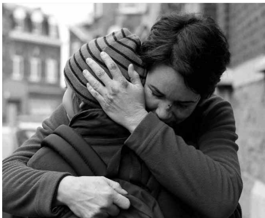
« Illégal », d'Oliver Masset-Depasse a été primée « Meilleure Co-Production au Lëtzeburger Filmpräis. Le drame émouvant qui raconte le système inhumain des centres de rétention en Belgique, sera à revoir dimanche à l'Ariston.