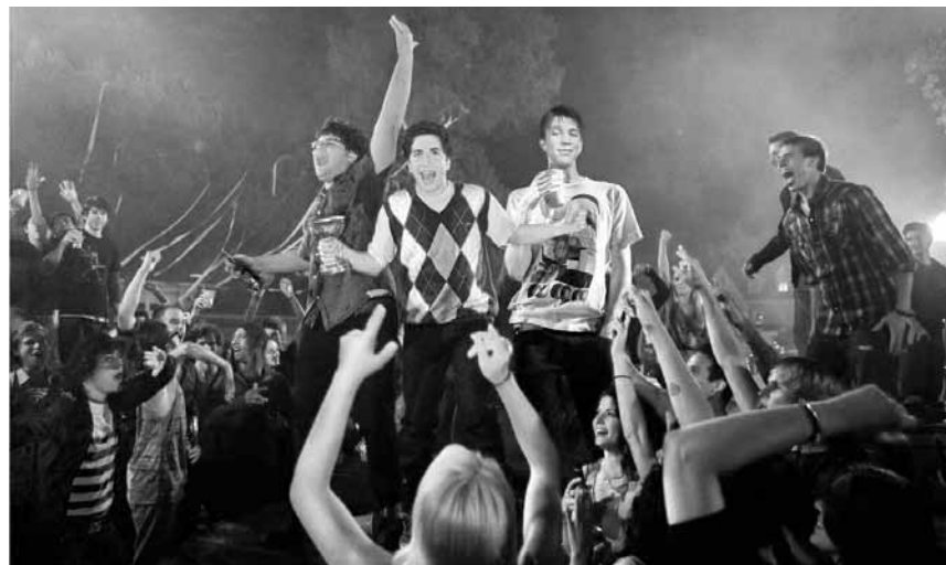
Nach der Party kommt das große Saubermachen: „Project X“, neu im Utopolis und im CinéBelval.

Der wohlhabende Anwalt Matt King lebt mit seiner Familie auf Hawaii, wo er zusammen mit seinem Clan ein wertvolles Stück Land besitzt. Er wird