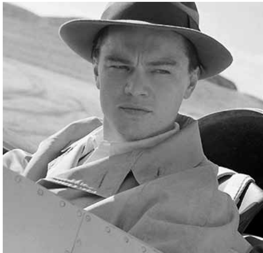
In „The Aviator“ wandelt Leonardo DiCaprio auf den Spuren des Millionärs Howard Hughes, am Dienstag in der Cinémathèque.

Bastian kehrt nach Phantasien zurück um es wieder einmal vor dem Nichts zu retten: „Die unendliche Geschichte (Teil 2) - Auf der Suche nach Phantasien“, am Sonntag in der Cinémathèque.