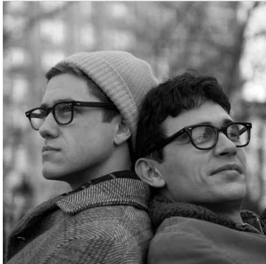
So könnte er ausgesehen haben, der Urknall der amerikanischen Beatgeneration: „Howl“, neu im Ariston und im Kursaal.

Benjamin, alleinerziehender Vater, sucht für sich und seine beiden Kinder eigentlich nur ein neues Zuhause und findet einen ganzen Zoo. Doch der heruntergekommene Tierpark, den Benjamin kaufen und neu eröffnen will, steht kurz vor dem Aus. Unterstützt wird Benjamin von der Tierpflegerin Kelly. Werden die beiden den Zoo retten können?