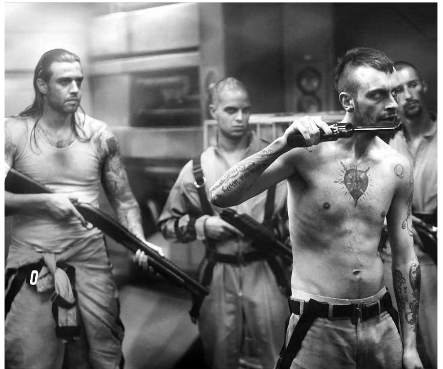
Sogar im Weltraum ist man vor Verbrechern nicht sicher: „Lockout“, neu im Utopolis und CinéBelval.

Das Sams hat sich bei den Taschenbiers eingelebt. Doch lebt man über zehn Jahre mit einem Sams unter einem Dach, wird man sich auch in ein Sams verwandeln. So geschieht es auch dem Herrn Taschenbier, der immer wieder verfressen, aufgekratzt und vorlaut ist, eben wie ein Sams, sich aber an nichts mehr erinnern kann, wenn er sich wieder zurück verwandelt hat.