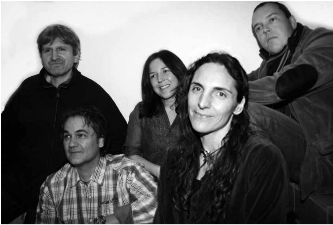
Une constante dans le rock luxembourgeois depuis 11 ans: Sonic Season.