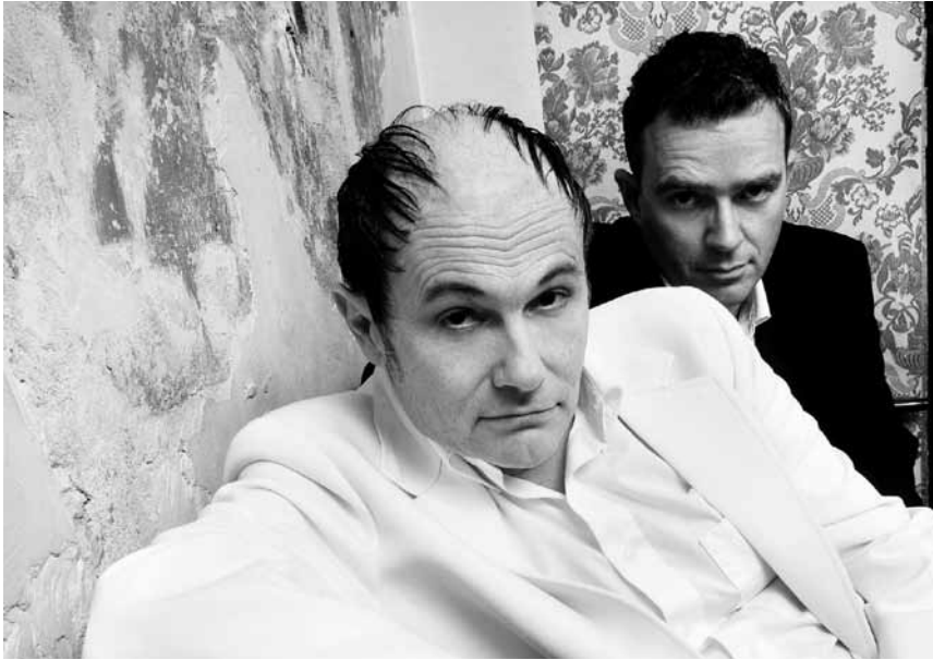
Das Berliner Kabarettduo Pigor & Eichhorn gastiert am 27. April im Centre des Arts Pluriels Ed. Juncker in Ettelbrück.

Großer Saal, Trier (D), 20h. Tel. 0049 651 7 18 24 12.