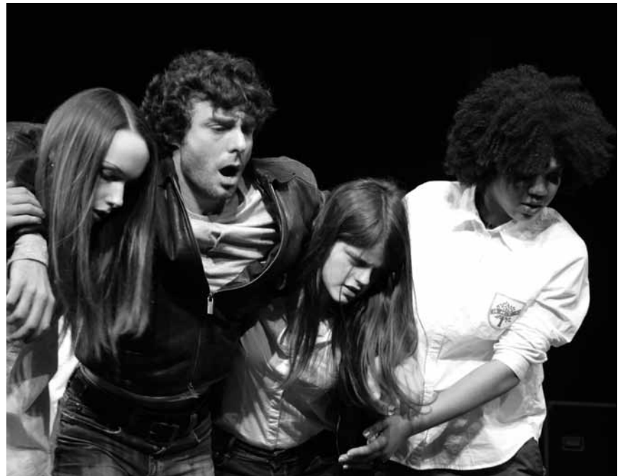
« Les enfants », par la Cie du Grand Boube est le fruit d'ateliers participatifs avec des jeunes et sera au Carré Rotondes le 20 avril.