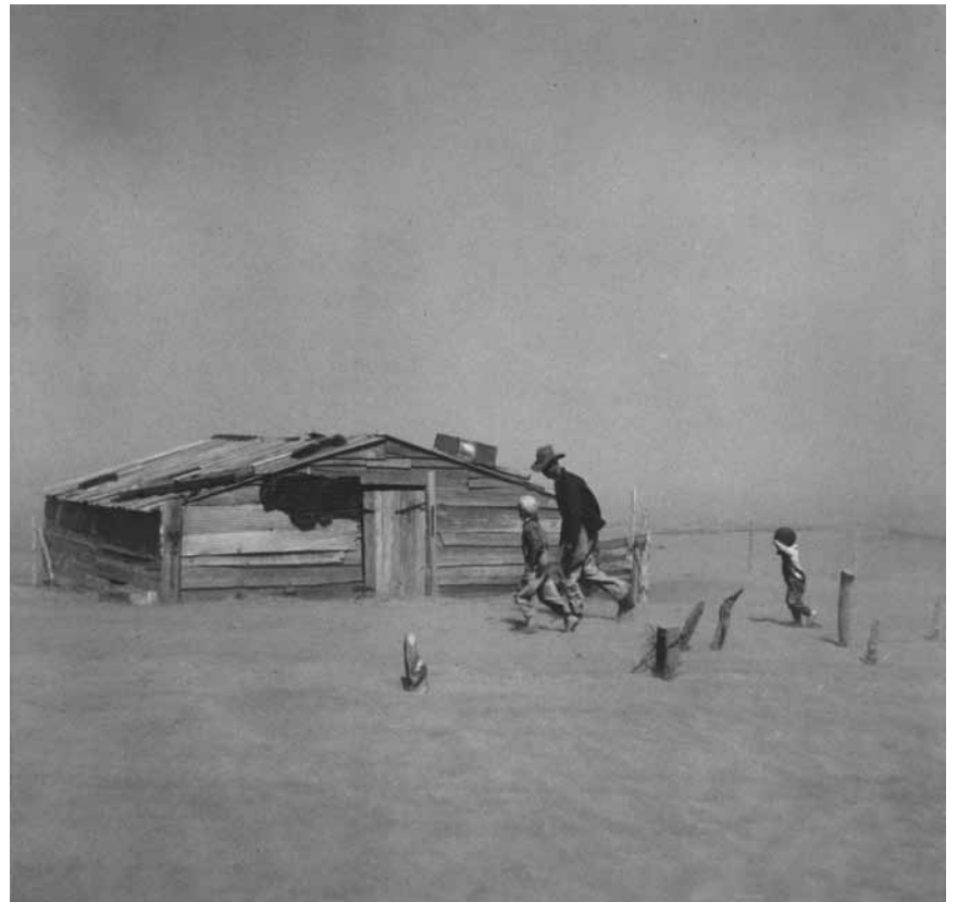
„The Bitter Years“ sind wieder zurück, nicht nur in den Wirtschaftsnachrichten, sondern auch im Düdelinger Wasserturm, der dieses Wochenende eingeweiht wird.