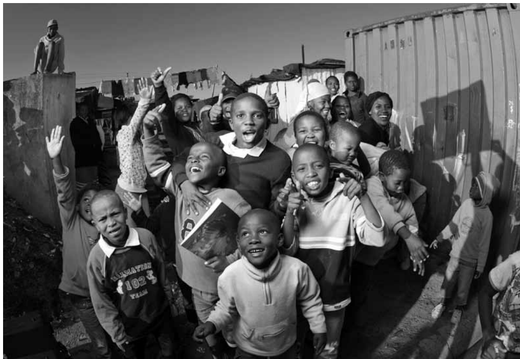
L'Afrique du Sud vue à travers l'objectif de Boris Frantz : « One with South Africa », jusqu'au 14 octobre au Parc Merveilleux à Bettembourg.

Visites guidées les me. 18h (L/F/D) + sa. 15h (L/F/D).