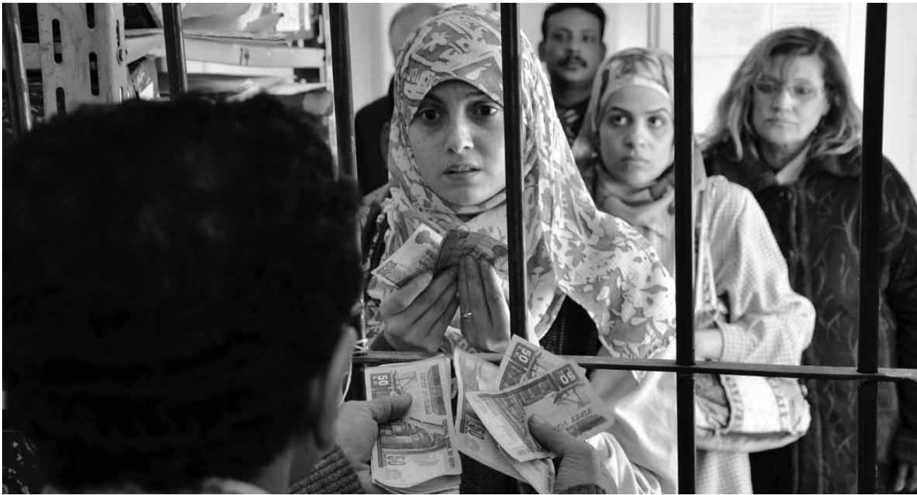
Ce n'est pas seulement la bureaucratie qui pose des problèmes aux femmes égyptiennes.