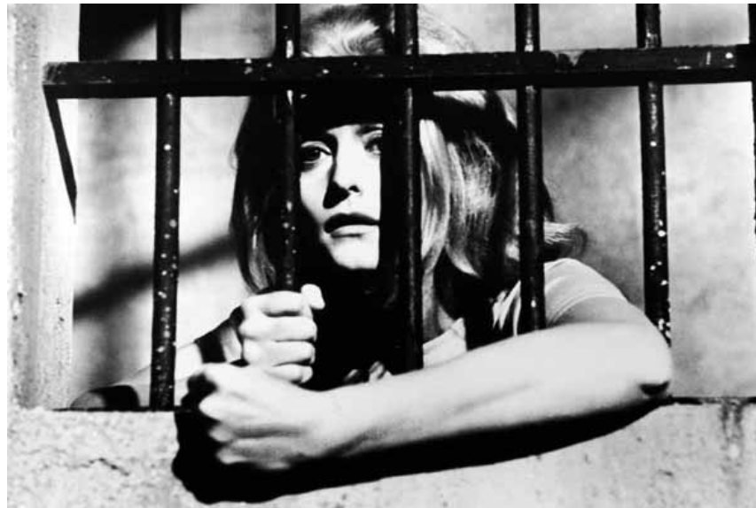
« The Naked Kiss » fait partie de la saga américaine que la Cinémathèque consacre ce lundi au réalisateur Samuel Fuller.

Un chien blanc a été conditionné à tuer les noirs et le dresseur noir qui tente de le rendre normal échouera.