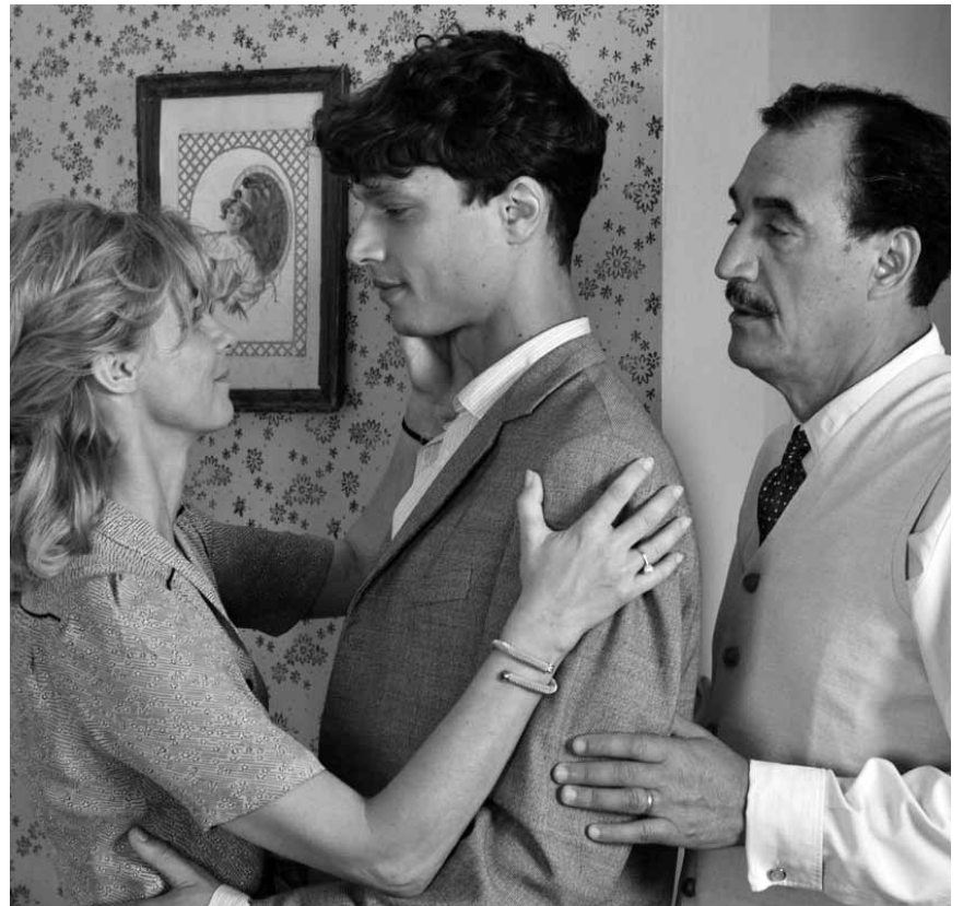
Une histoire d'amour qui défie la Grande Histoire : « Ce que le jour doit à la nuit », le succès français de l'été est nouveau à l'Ariston et au Kursaal.

Nach ihrer Afrika-Flucht wollen Löwe Alex, Zebra Marty, Giraffe Melman