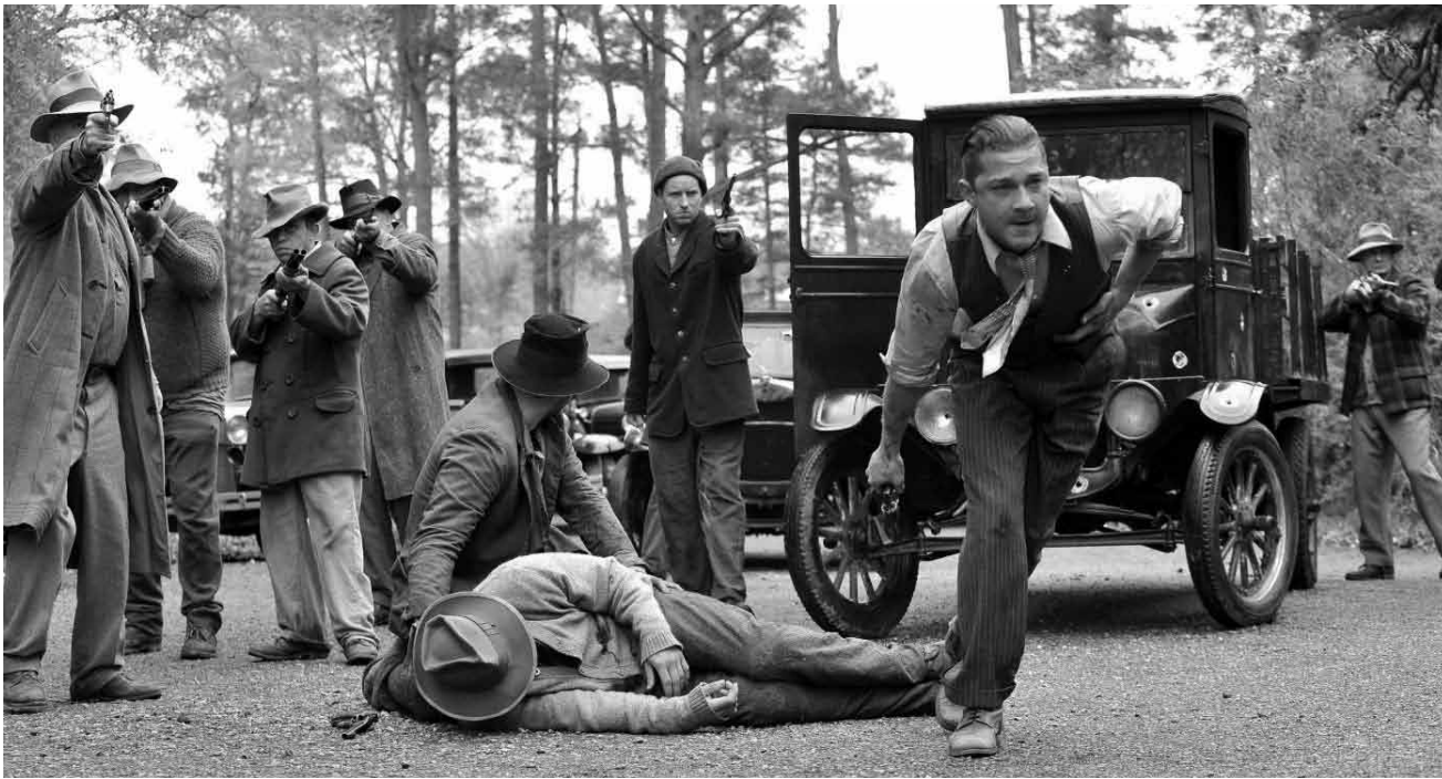
Brutalität gehört zum Geschäft, zumal, wenn man in der Illegalität operiert.