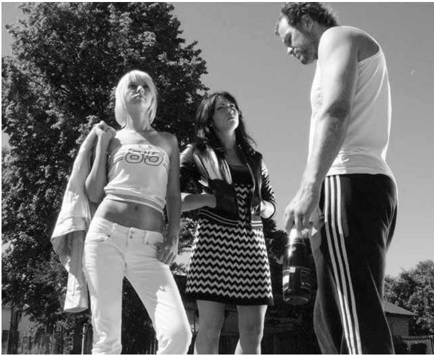
Dans le cadre du festival CinEast, la Lettonie sera à l'honneur avec « Kolka Cool », ce vendredi à la Cinémathèque.