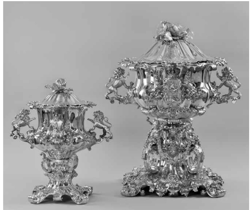
Schnell ansehen, ehe es die Royals doch verscherbeln: „Die großherzogliche Silberkammer“, im Nationalmuseum für Geschichte und Kunst, bis zum 13. Januar.

Fotografie, Malerei, Collagen und eine Installation, Ausstellungsraum der Tufa (Wechselstraße 4 - 6, 1. Obergeschoss, tél. 0049 651 4 07 17), bis zum 21.10., Mo., Di. + Mi. 14h - 17h, Do. + Fr. 17h - 20h, Sa. + So. 11h - 15h.