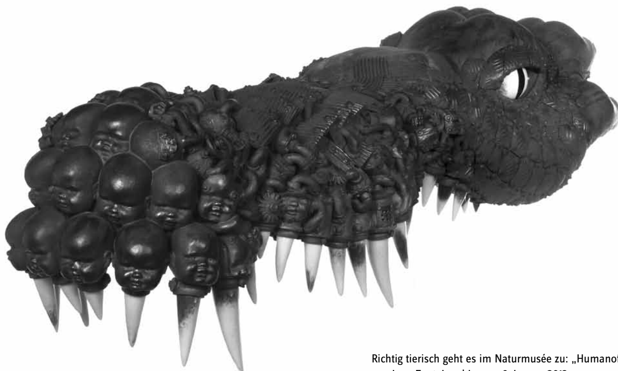
Richtig tierisch geht es im Naturmusée zu: „Humanofolie“, von Jean Fontaine, bis zum 6. Januar 2013.

NEW peintures, Centre de documentation et de recherche sur l'enrôlement forcé (3A, rue de la Déportation), jusqu'au 10.12, lu. - ve. 9h - 12h + 14h - 17h.