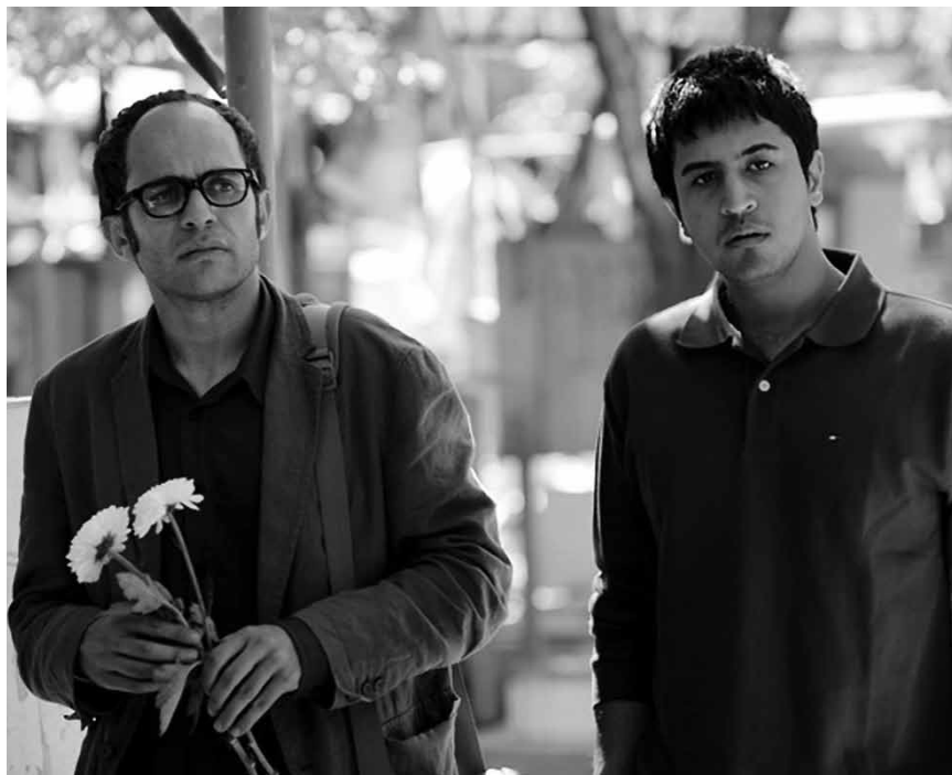
Ein iranischer Intellektueller verzweifelt an seiner eigenen Integrität: „A respectable Family“, neu im Utopia.