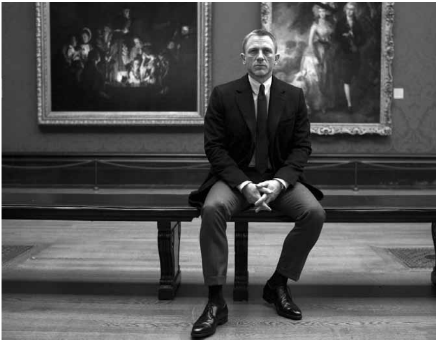
Auch die Agenten ihrer Majestät müssen sich von Zeit zu Zeit bei etwas Kunst erholen.