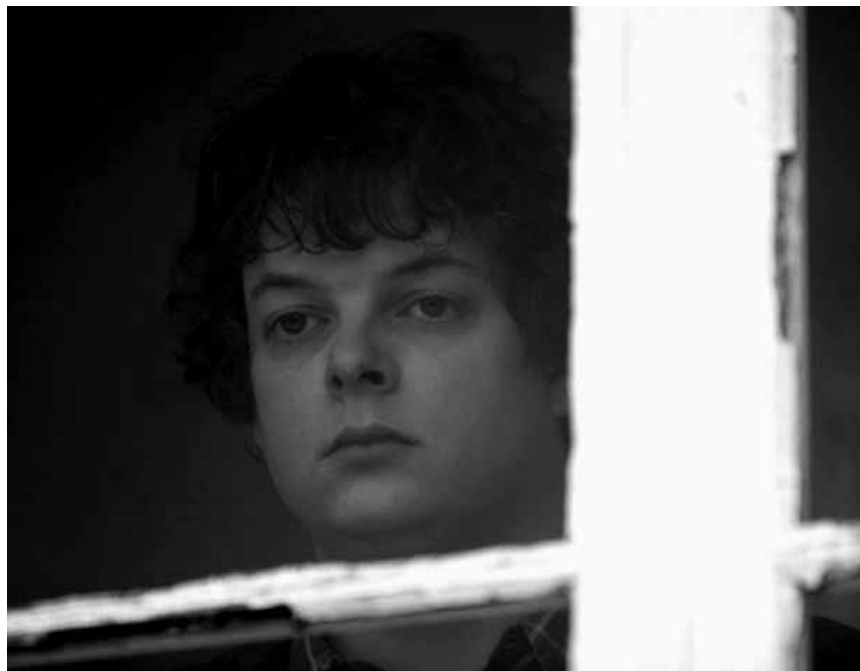
Dieu peut-il sauver une jeune urgentiste de sa détresse morale ? C'est la question que pose « La Neuvaïne », ce mardi à l'Utopia.

Regan, Gena und Katie werden zur Hochzeit ihrer einstigen Schulkollegin Becky eingeladen. Sie ist die erste die von ihnen allen vor den Traualtar tritt, obwohl sie dick ist und von den dreien