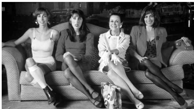
A la soirée « La Voix humaine », la Cinémathèque présente deux films dont les réalisateurs se sont inspirés du film de Jean Cocteau : « Una voce umana » scène du film « L'Amore » de Roberto Rossellini et « Mujeres al borde de un ataque de nervios » de Pedro Almodóvar.