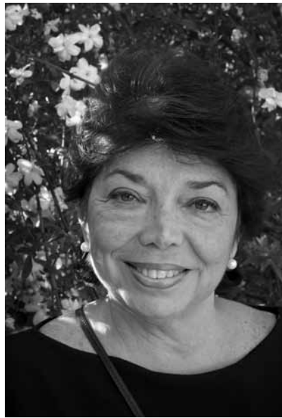
Leila Shahid présentera le « Tribunal Russell sur la Palestine », le 24 janvier à la Maison de la culture d'Arlon.