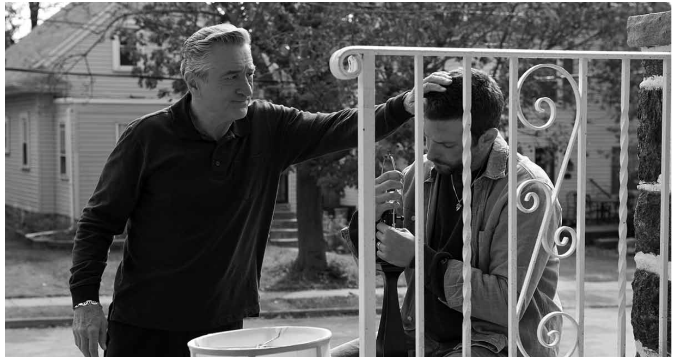
Pat, ein depressiver Enddreißiger, ist wieder bei Vater und Mutter eingezogen. „Silver Linings Playbook“, neu im Utopolis.

Ende der 1940er Jahre beherrscht der Mafia-König Mickey Cohen den Untergrund von L.A. Er zieht seine Gewinne aus Drogen- und Waffenschmuggel, Prostitution