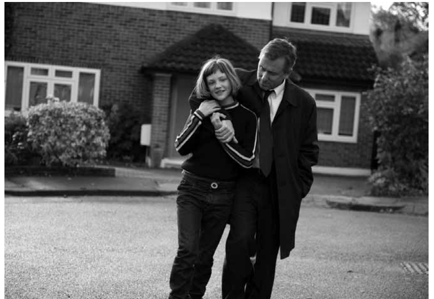
Eine Kindheit im Schatten von Krankheit und Ausschließung: „Broken“, neu im Utopia.