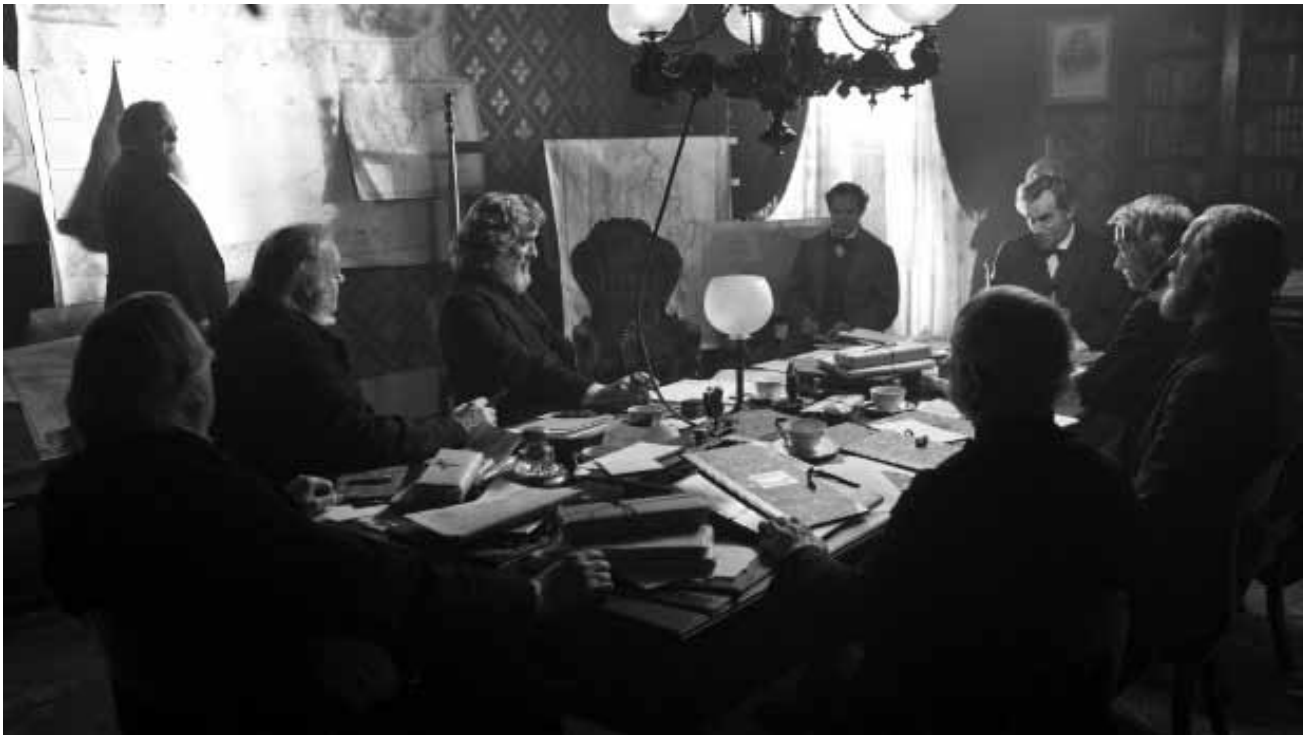
Lincoln muss die Demokraten mit allen Mitteln dazu überreden die Sklaverei aufzugeben.