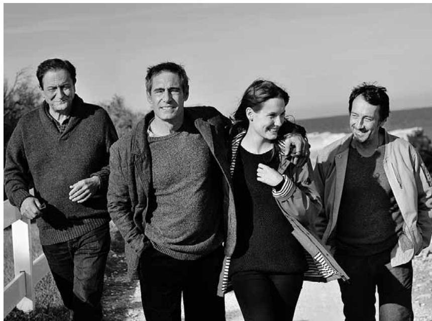
L'honnêteté n'est pas ce dont a besoin le plus pour garder ses amis... « Amitiés sincères », nouveau à l'Utopia.

1874. Die schöne und lebenslustige Anna Karenina hat alles, was sich ihre Zeitgenossinnen erträumen: Sie ist die Ehefrau von Karenin, einem hochrangigen Regierungsbeamten, dem sie einen Sohn geboren hat, und ihr Status in der St. Petersburger Gesellschaft könnte kaum höher sein. Als Anna dem attraktiven Kavallerie-