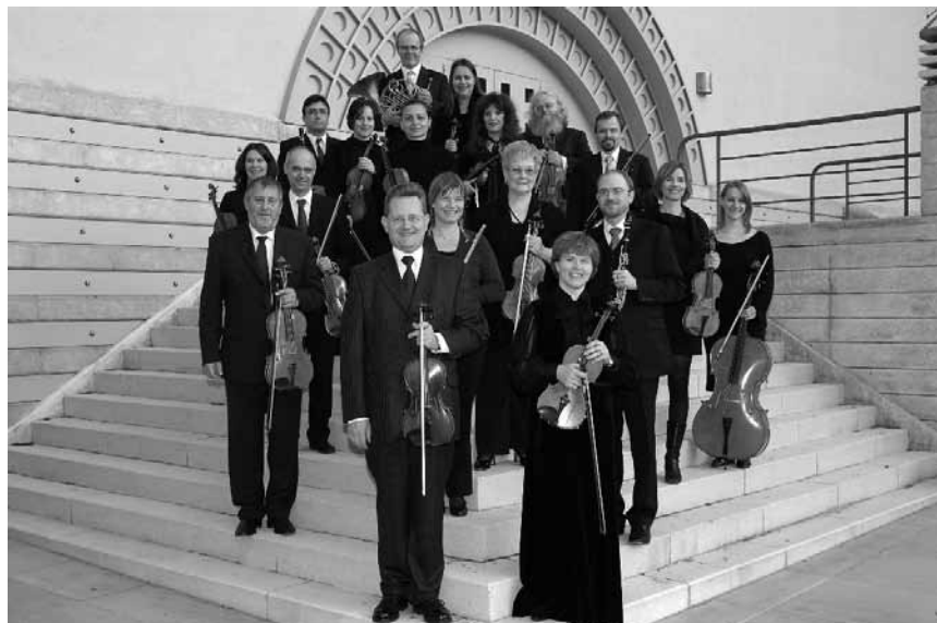
Pour célébrer encore une fois l'hiver « Sounds from Russia » avec l'orchestre Estro Armonico...

Sounds of Russia , chants russes avec l'orchestre Estro Armonico et les chorales réunies de Mertert, Itzig