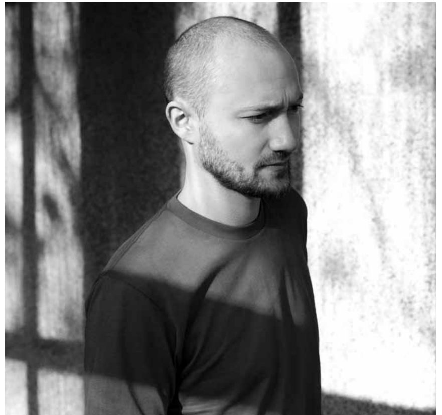
Hat den Techno von Kindesbeinen an im Blut: Paul Kalkbrenner legt am 1. Februar in der Rockhal auf.