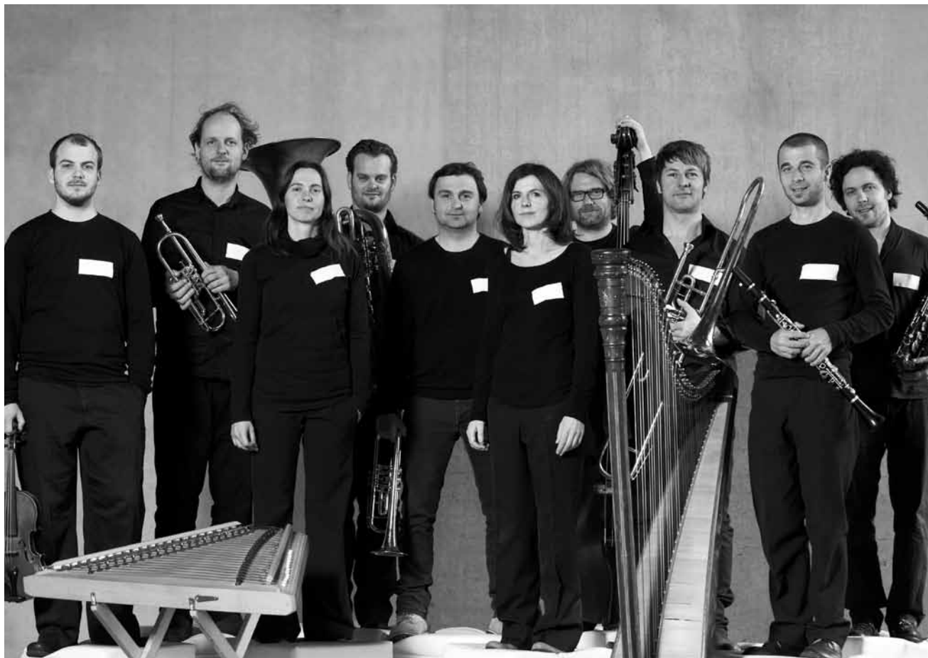
et les chorales réunies de Mertert, Itzig et Moutfort, le 2 février à l'abbaye de Neumünster.

Les 5 gourmets , quatuor de cuivres, Trifolion, Echternach , 16h. Tél. 47 08 95-1.