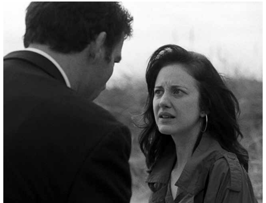
Eine Familiengeschichte im Schatten des Nordirland-Konflikts: „Shadow Dancer“, neu im Utopia.

A travers Oscar, un petit chimpanzé, nous découvrons l'apprentissage de la vie au coeur de la forêt tropicale africaine et suivons avec humour, émotion et angoisse ses premiers pas dans ce monde. Suite à un drame, il va se retrouver séparé de sa mère et laissé seul face à l'hostilité de la jungle. Jusqu'à ce qu'il soit récupéré par un chimpanzé plus âgé, qui va le prendre sous sa protection.