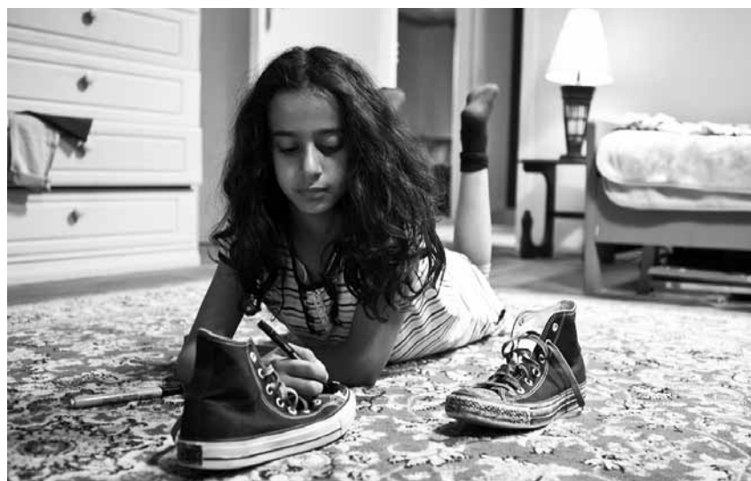
Tout ce qu'elle veut est un vélo, mais elle se prend les fanatiques islamistes sur le dos : « Wadja », nouveau à l'Utopia.