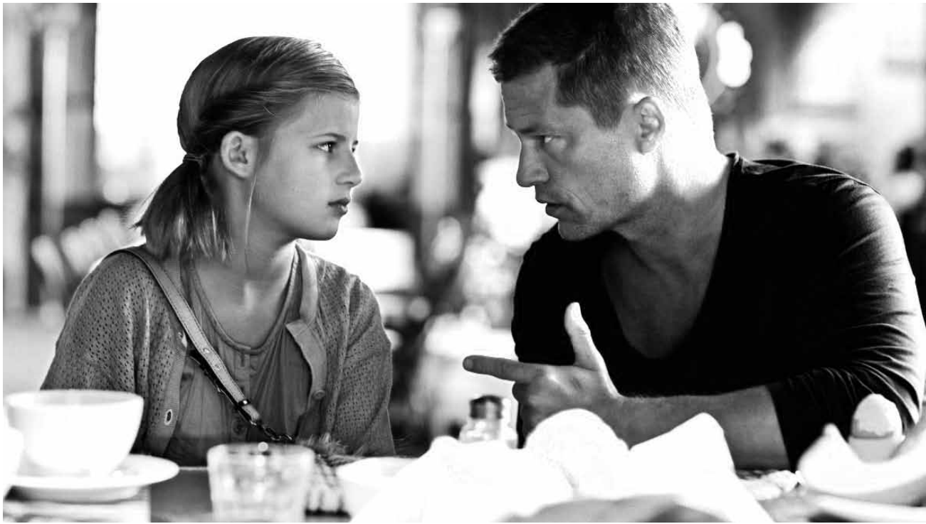
Til Schweiger versucht immer noch lustige Filme zu drehen: „Kokowääh 2“, neu in den Kinos Ciné Belval, Starlight, Sura und Utopolis.

aufgegeben hat, sorgt er im verschlafenen Grenzstädtchen Sommerton Junction für Recht und Ordnung. Mit der Ruhe ist jedoch vorbei, als der berühmte Drogenboss Gabriel Cortez aus einem FBI-Gefängnis transport entkommen kann und in Richtung mexikanische Grenze flieht. Voir Filmtipp page 11.