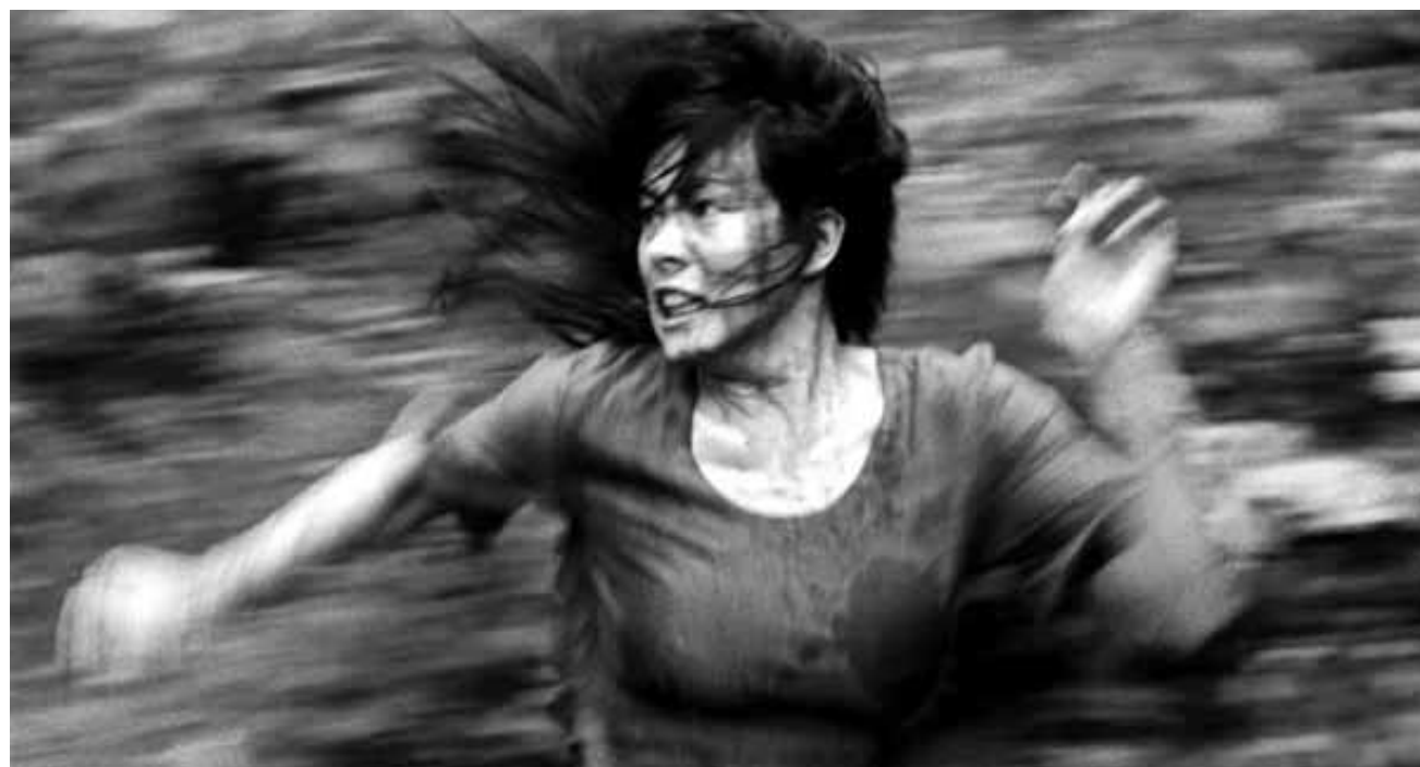
La vengeance pour un crime mystérieux tourne au drame. « Martyrs », samedi à la Cinémathèque, dans le cadre de Filmreakter's Cinélunatique.

Le poète Orphée est bousculé par un jeune rival, Cégeste, qui tente d'entraîner une mystérieuse dame à la Rolls noire. Une bagarre éclate : Cégeste est renversé par deux