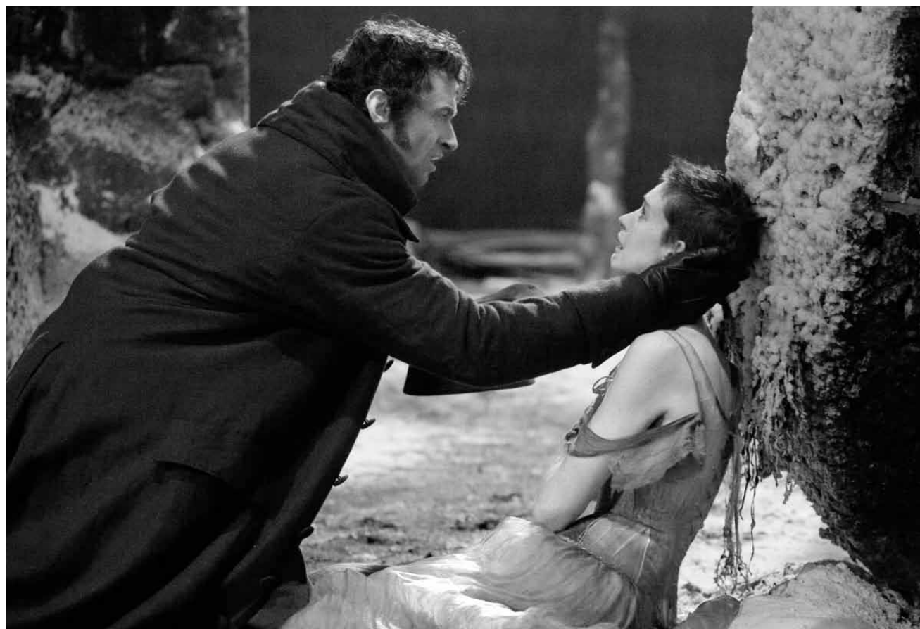
Victor Hugo muss für Hollywood wieder einmal den Kopf hinhalten: „Les Misérables“, neu im Ciné Belval und im Utopolis.