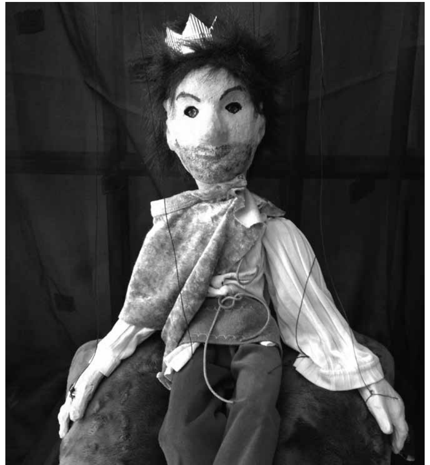
„D'Sonny sicht e Mäerchepräenz" - den neie Marionette-Spektakel vum Bimbo-Theater ass nach den 12. an de 14. Februar an der Neumünster-Abtei ze gesinn.