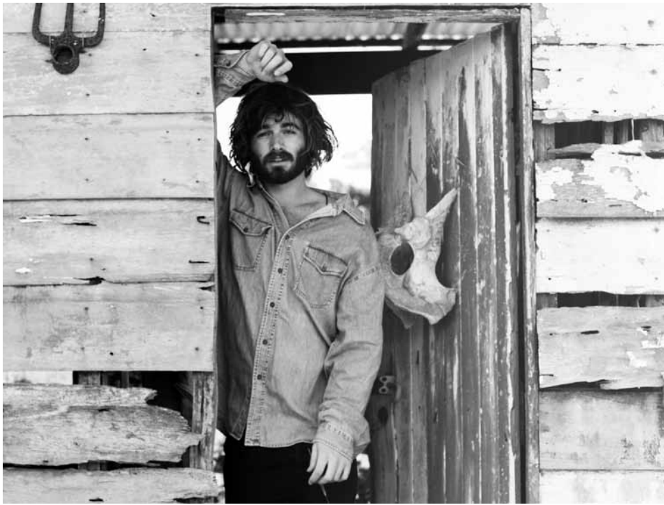
Hat nicht nur den Blues, sondern auch den Folk im Blut: Angus Stone.