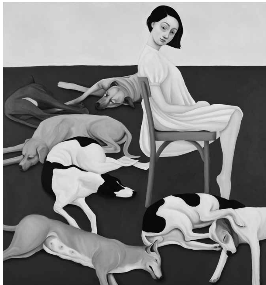
Les portraits extraordinaires que nous concocte Nina Mambourg sont à voir - sous le titre « Entre nous » - à la galerie Clairefontaine, jusqu'au 27 avril.

collection Mudam, Musée d'Art Moderne Grand-Duc Jean (parc Dräi Eechelen, tél. 45 37 85-1),