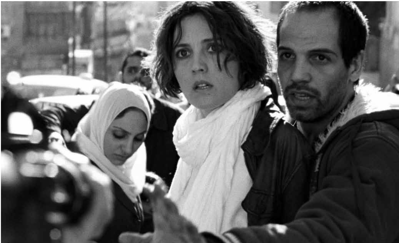
Prise dans les troubles d'une guerre qui n'est pas la sienne, Chloé va aller au-delà de ses limites.