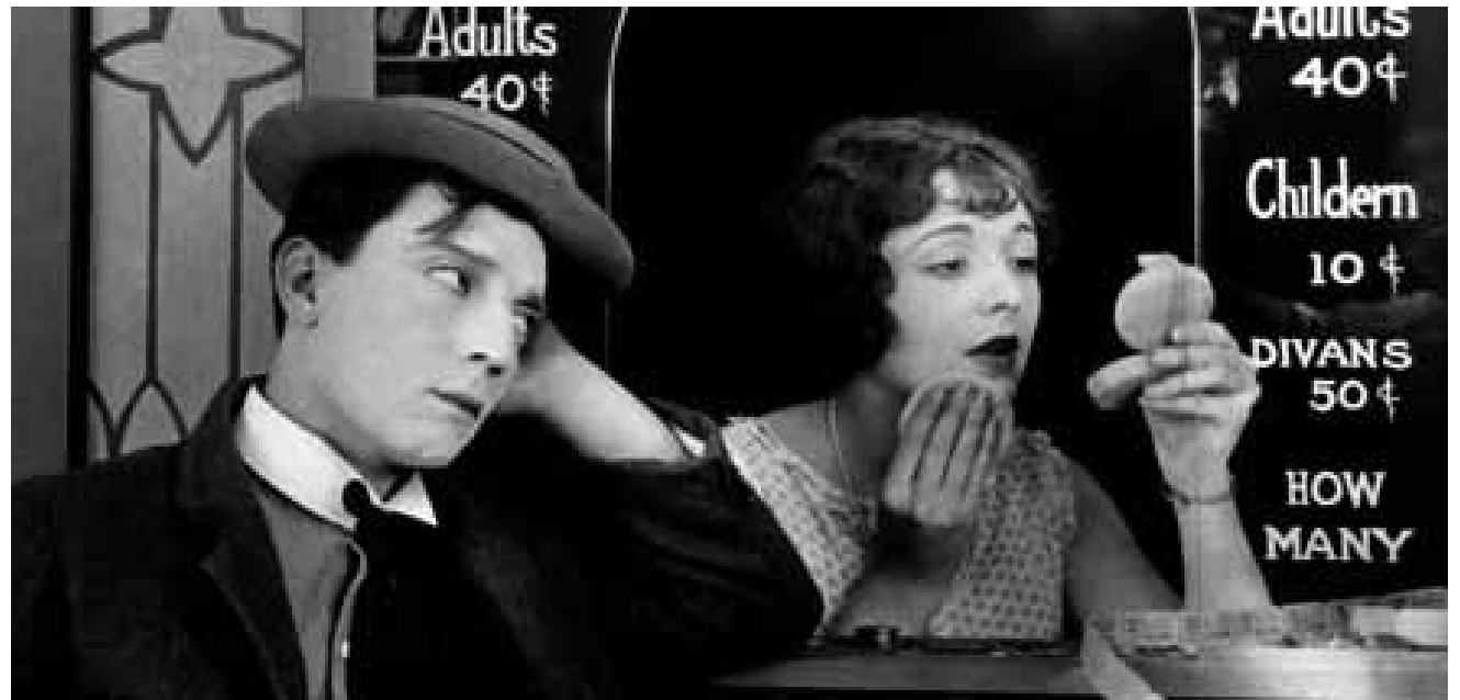
Buster Keaton dans toute sa finesse dans « Sherlock Jr. », mardi à la Cinémathèque. Dans le cadre de la Ciné-conférence « The Purple Roses of Luxembourg » avec Paul Lesch.

Cinq New-Yorkais passent l'essentiel de leur temps à voir des films dans les différents cinémas répertoire de leur ville. Ils nous racontent le pourquoi du comment de leur démarche quotidienne où ils se précipitent dès l'ouverture des cinémas pour voir tous les jours au moins trois films.