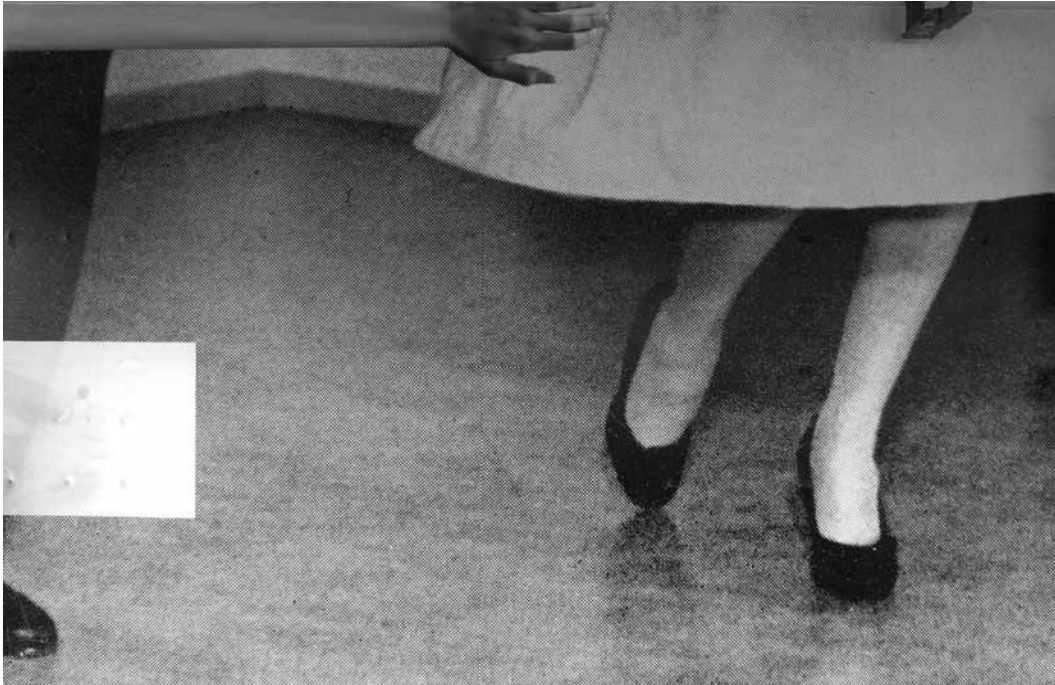
Belle féerie mécanique, l'installation de Sophie Jung au kiosque de l'Aica.