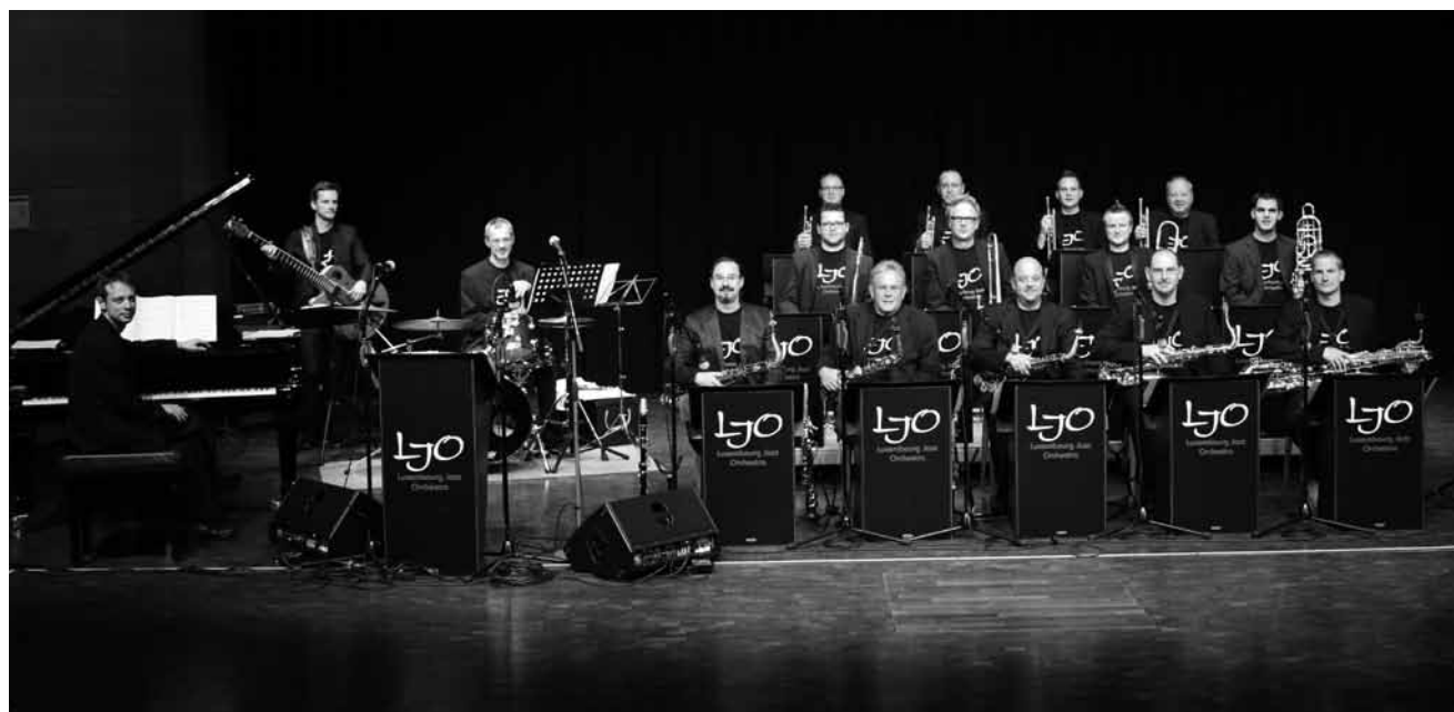
Le printemps musical de la ville de Luxembourg propose pour le 6 mai une collaboration exclusive entre les vocalistes jazz du New York Voices et le Luxembourg Jazz Orchestra, au Conservatoire de la ville de Luxembourg.