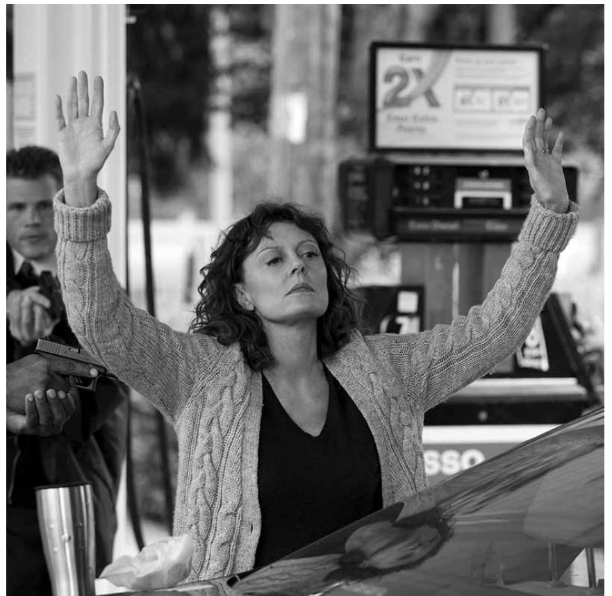
Vergangenheitsbewältigung à l'américaine: „The Company You Keep“ beschäftigt sich mit den linksextremen Terroristen der „Weathermen“, neu im Utopolis.