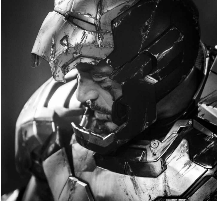
Iron Man - Robert Downey Jr. Paraderolle als Superheld ist auch in der dritten Episode sehenswert.