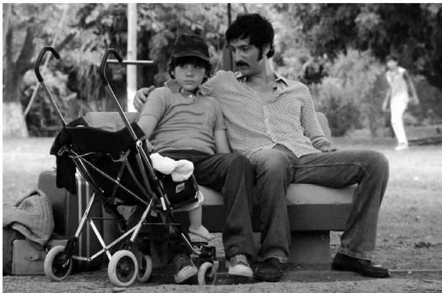
L'histoire d'une enfance argentine, passée sous une fausse identité : « Infancia Clandestina », nouveau à l'Utopia.

se lancent alors dans une nouvelle vie de gamins pleine de péripéties, persuadés que la liberté est ailleurs.