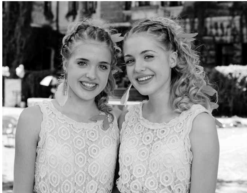
Geschlechteridentitäten aus den 1950er Jahren und andere Horrorstories kann man sich in „Hanni und Nanni 3“ reinziehen. Neu in den Kinos.

Jidderee kennt d'Geschicht vom Pinocchio: Enges Daags meesselt de Schräiner Gepetto aus engem Stéck Holz eng Marionette, déi him Gesellschaft leeschten soll a vir hien wéi säin eegene Jong soll sinn. Déi gëtt da lieweg an erliwt eng Hällewull verschidden Abenteuer.