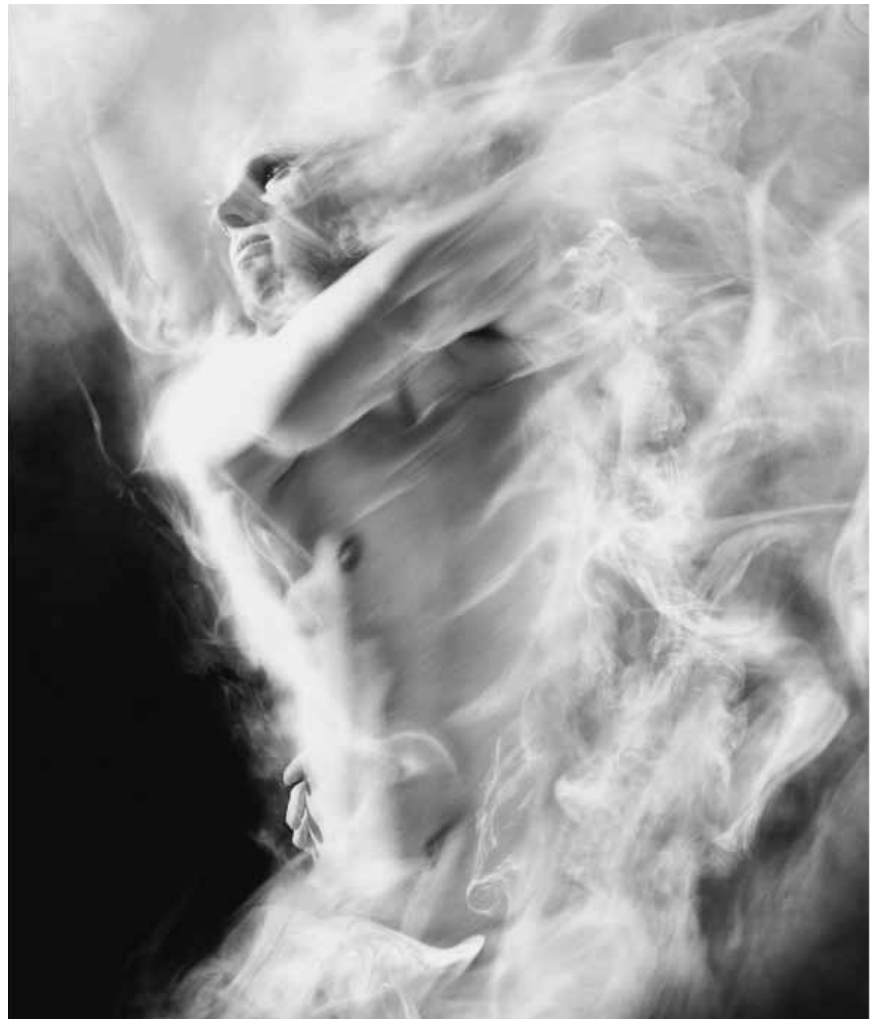
Christoph Ransmayers „Strahlender Untergang“ beschäftigt sich mit der Sinnfrage des Menschseins und seinem Umgang mit der Wissenschaft - am 10., 23. und 24. Mai sowie am 3. und 4. Juli in der Tufa in Trier.