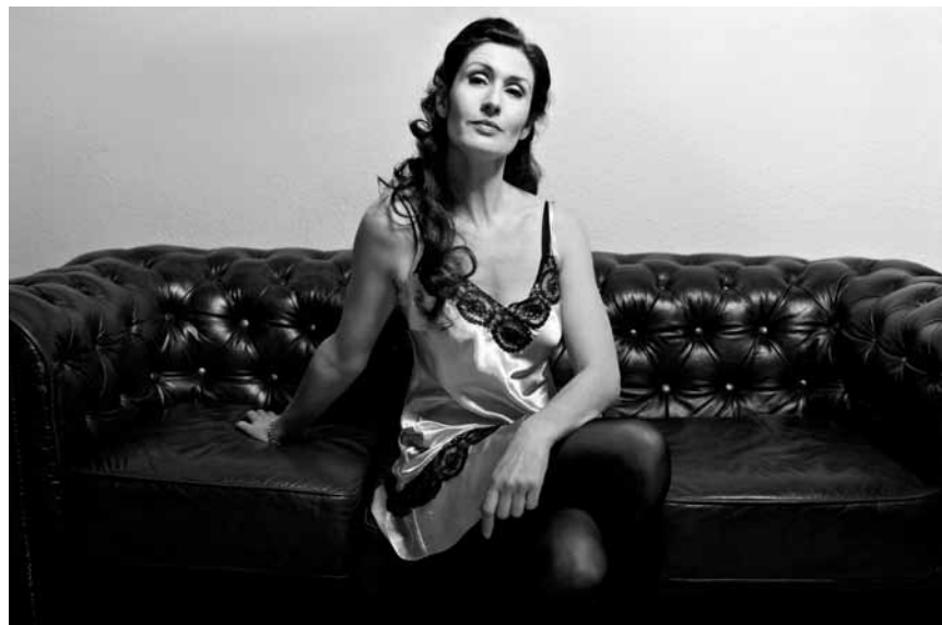
Ein Klassiker neu inzeniert: „Die Katze auf dem heißen Blechdach“, am 11., 14. und 17. Mai im Theater Trier.

Sirius Plan + Les Amis de Brassens + Mai Lan , Purple Lounge au Casino