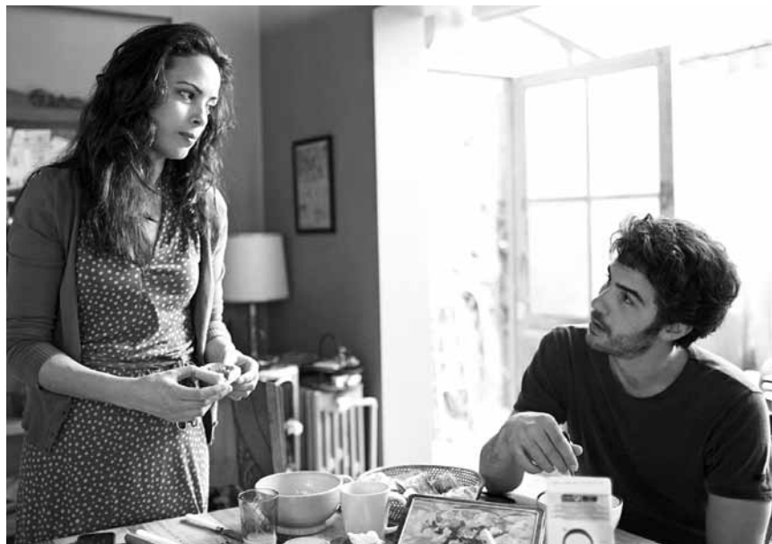
Dans « Le passé », un couple irano-français découvre petit à petit des secrets cachés depuis trop longtemps, nouveau à l'Utopia.

Eine Tochter fahndet während einem Jahrzehnt nach dem gestohlenen Instrument ihres Vaters, ein Handwerker sucht den besten Weg um ein perfektes Stück Holz zu gestalten. Ein Solist reist musizierend um die Welt und ein Nachahmer frischt den Klang der großen Meister auf. Das Cello - mehr als ein Instrument.