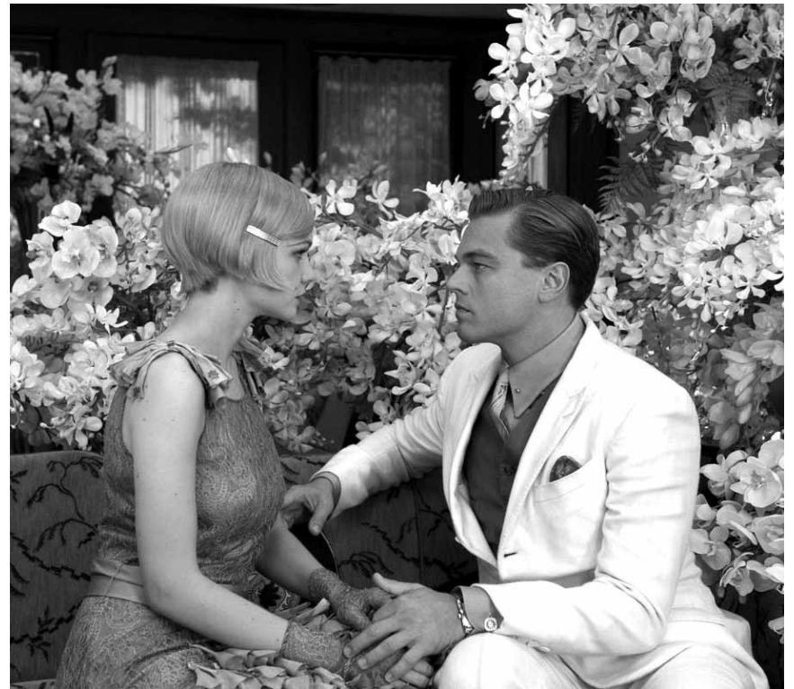
Das kann ja fast nur gut gehen: „The Great Gatsby“, Fitzgeralds tragisches Meisterwerk, mit Starbesetzung relooked von Baz Luhrman, und dazu noch in 3D! Neu in den Kinos.