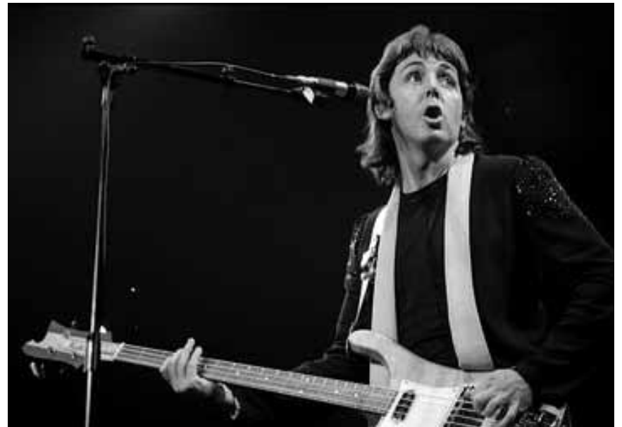
Back when Paul McCartney still had his Wings: „Rockshow“ features 30 songs from the 1976 North American Tour of the ex-Beatles' best known band. Tuesday at the Utopia.