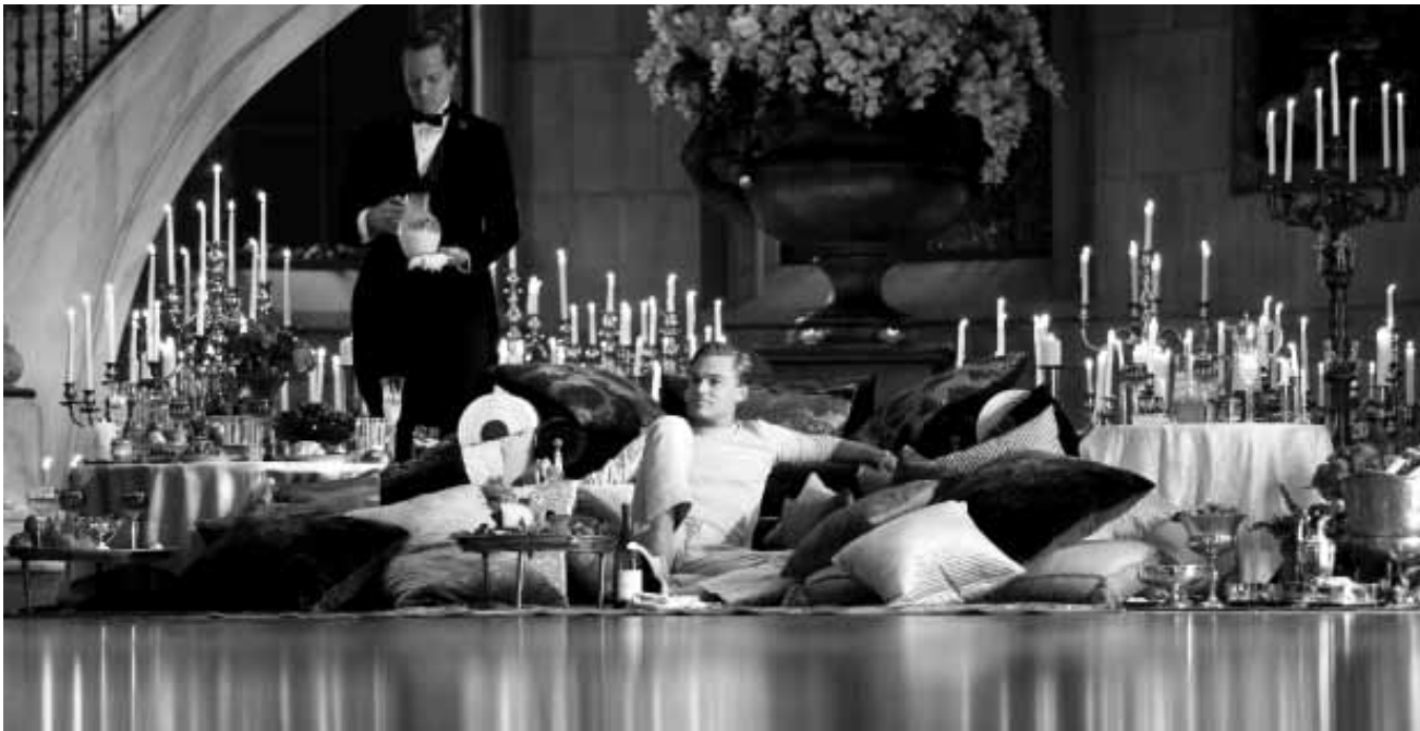
Flach, trotz 3D: „The great Gatsby“ ertrinkt in Effekten.