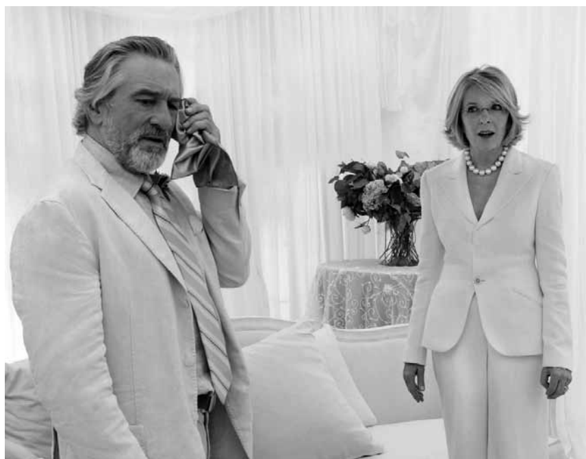
Wie gaukelt man hochreligiösen Fanatikern einen keuschen Lebenswandel vor? Robert de Niro weiß die Antwort in „The Big Wedding“. Neu im Ciné Belval, Ciné Waasserhaus, Kursaal und Utopolis.