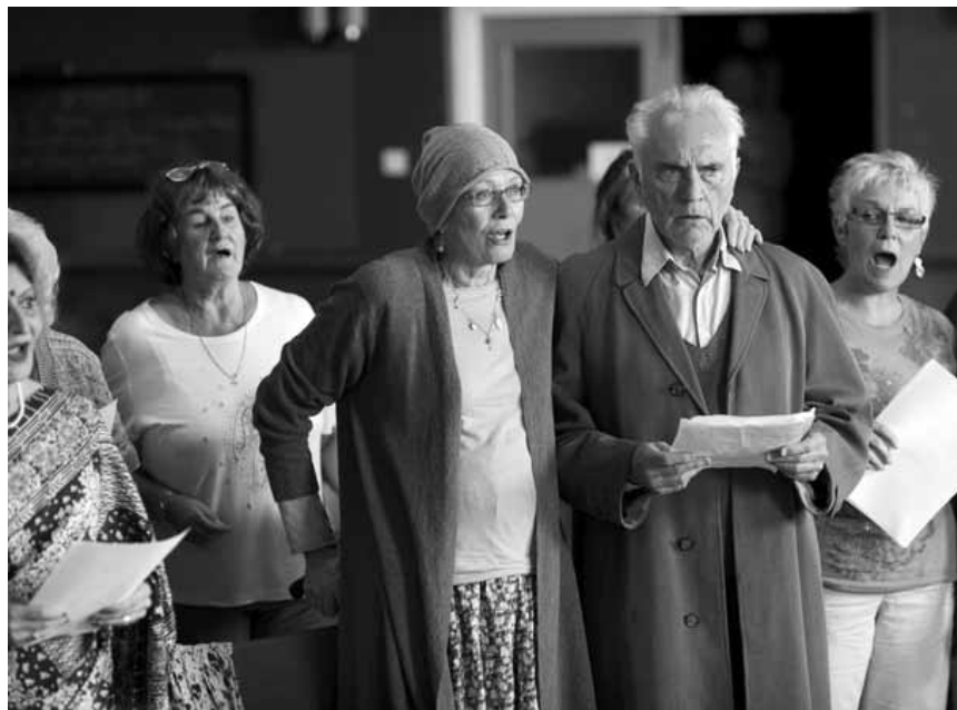
Sterbebegleitung kann schon mal Heavy Metal sein. „Song for Marion“, neu im Utopia.

Avec ses 12 pourcent de réussite au bac, le lycée Jules Ferry est le pire lycée de France. Ayant déjà épuisé