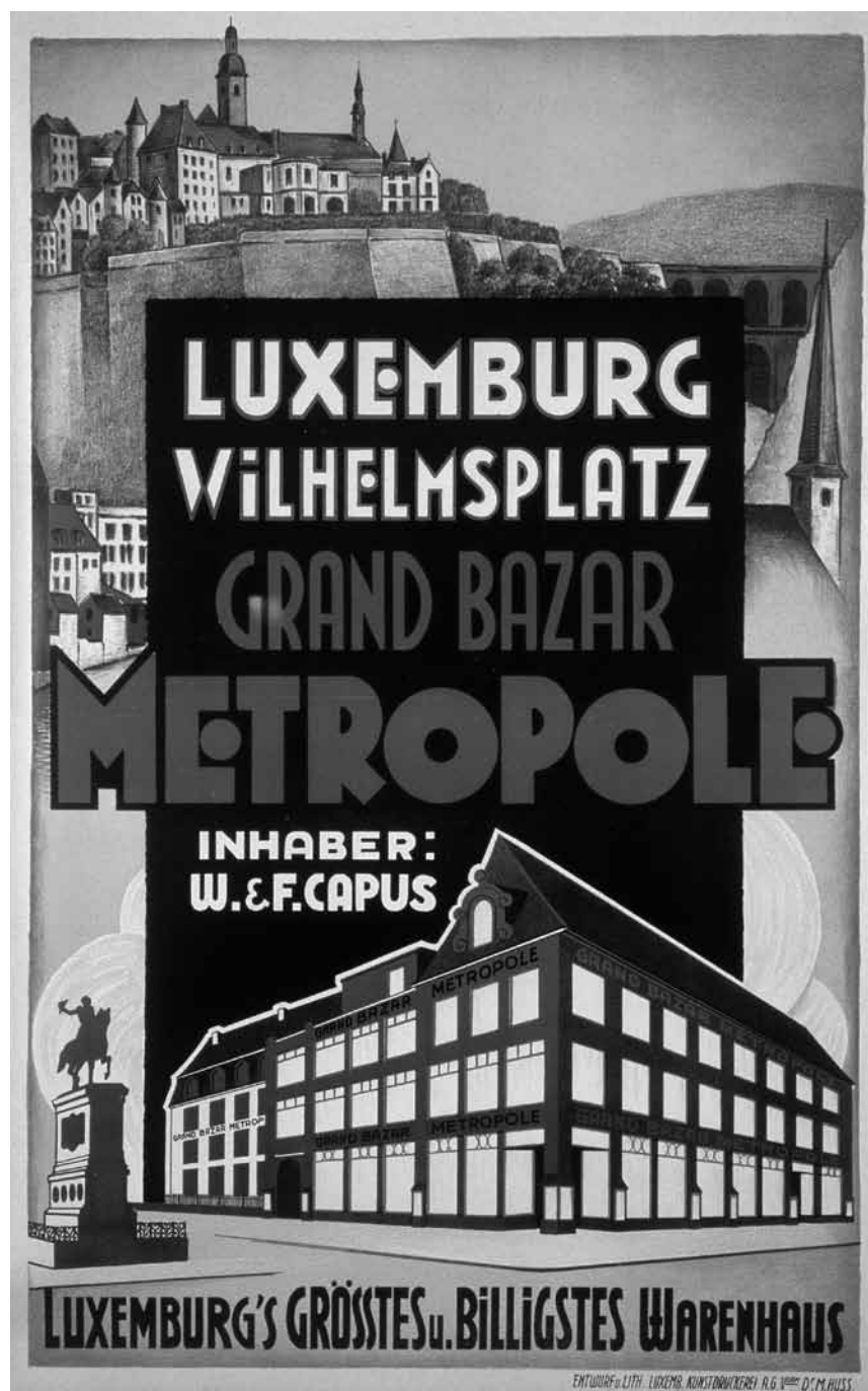
Die Veränderungen in der Geschäftswelt sind Thema der Ausstellung „Shop Shop Shop“. Im Historischen Museum der Stadt Luxembourg noch bis zum 30. März 2014.

Centre de Langues (21, boulevard de la Foire), bis de 5.7., Méi. - Fr. 8h - 18h,