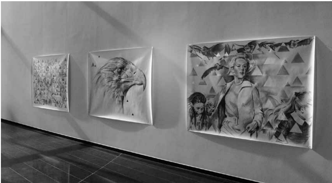
Hat Kapitalismuskritische Pop-Art ausgedient?