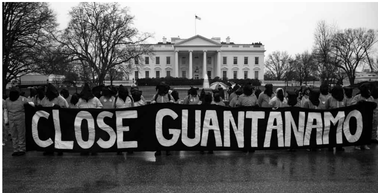
Une prison sans loi... « Guantanamo : bientôt la fermeture ? » Amnesty International invite le lundi 3 juin à une projection-débat à l'Exit07.

Dämpelen a Wisen zu Réiser , Owesekursion, Rendez-vous beim Café Op der Millen, Berchem, 19h.