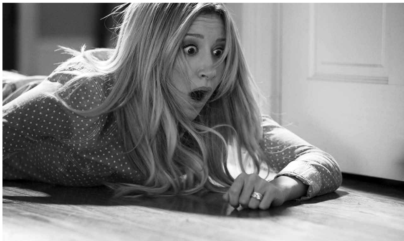
Nur für eingefleischte Fans von Mash-Ups: „Scary Movie 5“ veräppelt mal wieder die neuesten Horrorfilme, neu im Utopolis und Ciné Belval.

30 Jahre nach der faktischen Auflösung der linksradikalen Terroristengruppe wird das ehemalige „Weather Underground“-Mitglied Sharon Solarz verhaftet. Der talentierte junge Journalist Ben Shepard wird auf den Fall