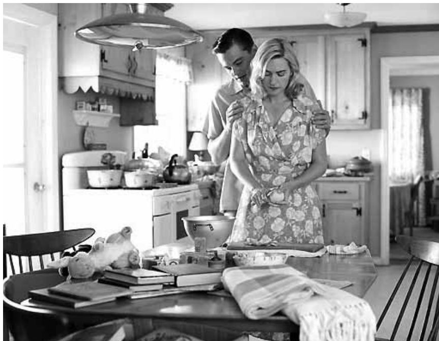
„The Revolutionary Road“ zeichnet den Weg eines Paares nach, das von glücklichen Individualisten zu selbsthassenden Spießern wird. Am Samstag in der Cinémathèque.

Realität und Fantasie vermengen sich zusehends. Am Ende gibt es tatsächlich jeweils einen Toten, doch hat wirklich Lorna sie auf dem Gewissen?