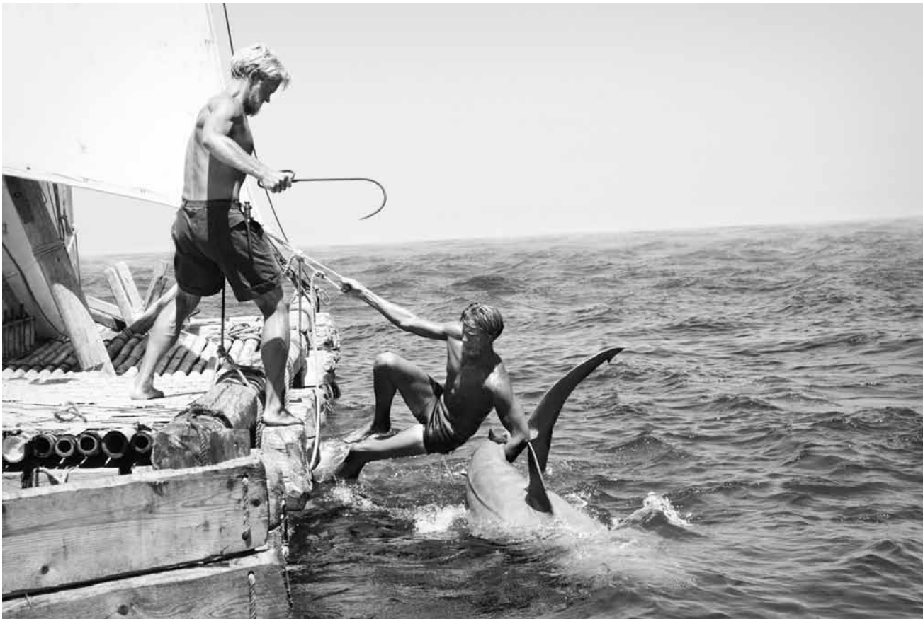
Thor Heyerdahl und sein Floß - wohl eine der vergessenen Legenden des 20. Jahrhunderts: „Kon-Tiki“, neu im Utopia.

Amin est un chirurgien israélien d'origine palestinienne. Il a toujours refusé de prendre parti dans le conflit qui oppose son peuple à son peuple d'adoption et s'est entièrement consacré à son métier et à sa femme Sihem. Jusqu'au jour où un attentat se produit à Tel Aviv. Son ami Naveed, policier, lui annonce alors que Sihem a été tuée et qu'elle est en plus soupçonnée d'être la kamikaze. Voir Filmtipp page 11.