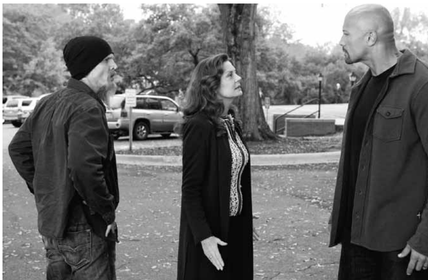
Verpfeifen oder in den Bau wandern? Diese Frage stellt sich hier „Snitch“ - neu im Utopolis.

Utopolis, Fr. - Di. 21h45 (O.-Ton, fr. + nl. Ut.),