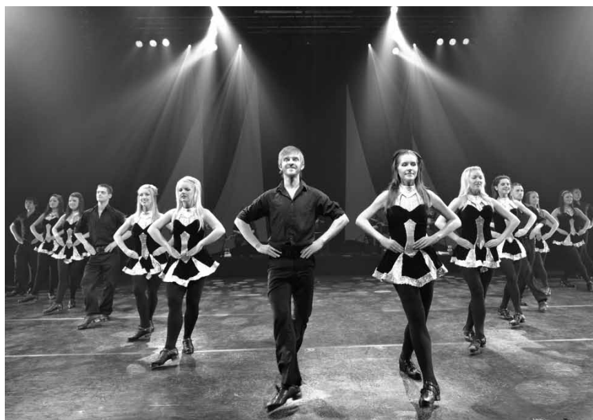
« Celtic Legends » est un show musical et de danse typiquement irlandais. En ouverture du Festival international de Wiltz, le 28 et le 29 juin.

Die Grönholm-Methode , Schauspiel von Jordi Galceran, sparte4 (