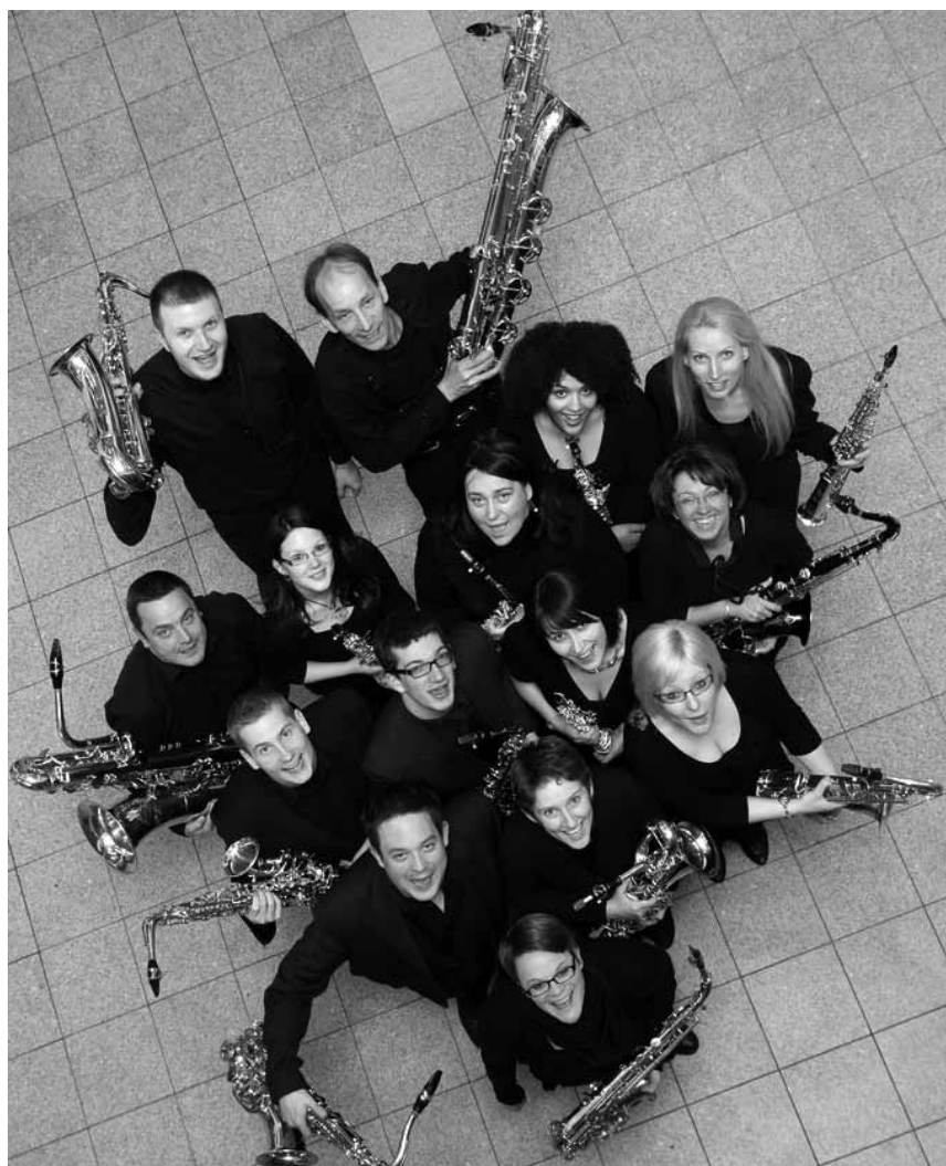
La formation « LuxSax » se propose de mettre en lumière les différentes oeuvres de Tchaïkovsky, Glazounov, Ravel et autres avec le saxophone. Au Centre des Arts Pluriels Ed. Juncker, le 29 juin.