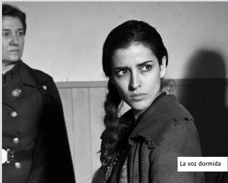
La voz dormida