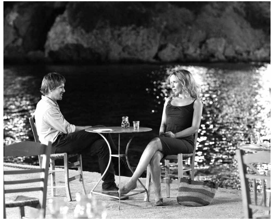
„Griechischer Wein ...“ Auch in „Before Midnight“ wird die hellenische Republik zum Schauplatz von Erweckungserlebnissen. Neu im Utopia.

☼☼☼ Ce film montre que les Palestiniens ne sont ni tous des terroristes et ni les Israéliens des monstres. (avt)