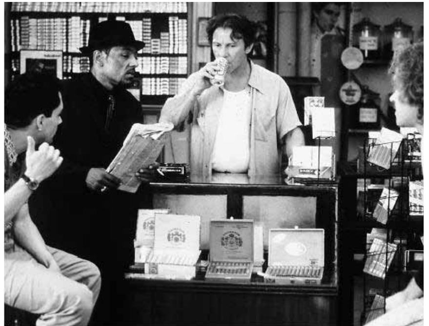
Dans „Smoke“, un petit magasin devient carrefour de rencontres et d'intrigues. Ce vendredi à la Cinémathèque.