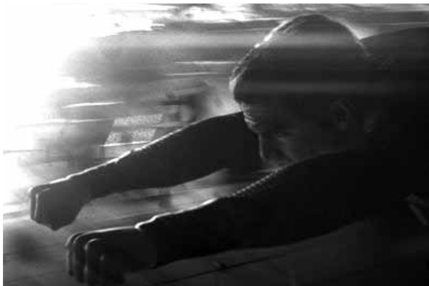
So schnell ist der Mann...