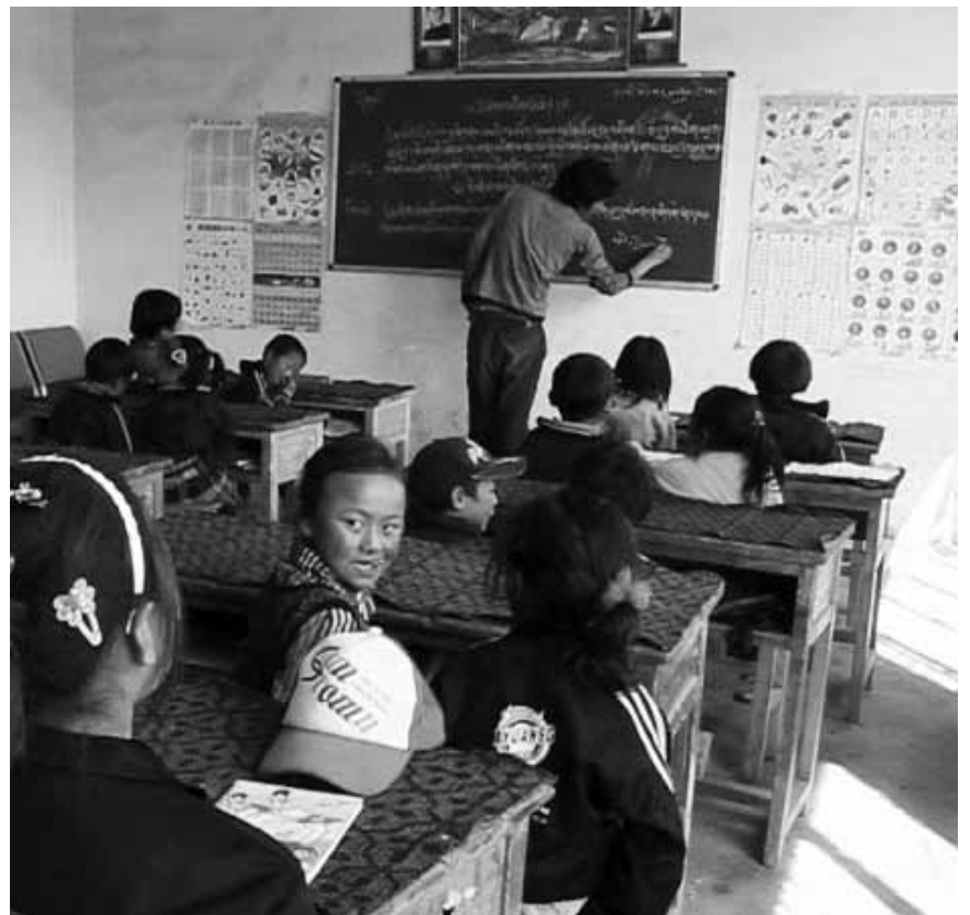
Sitzenbleiben? Wie kann eine Schulausbildung bei Nomadenkindern aussehen? Thema im Dokumentarfilm „A Better Road“. Zu sehen im Wiltzer Prabbeli an diesem Freitag.