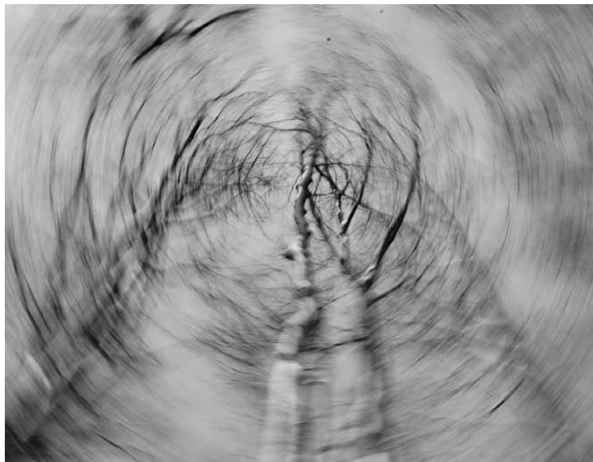
Arbres tordus ? Céline Evans expose ses photographies au Moulin de Beckerich jusqu'au 21 juillet.