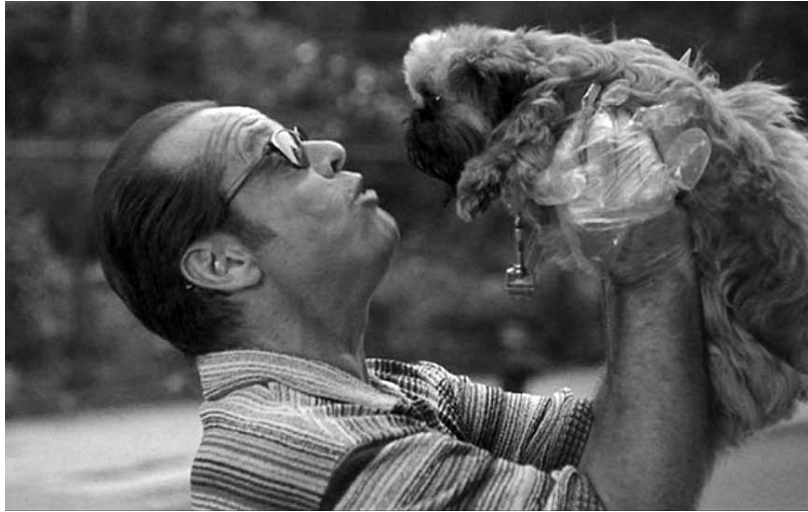
Jack Nicholson dans « As Good As It Gets ».