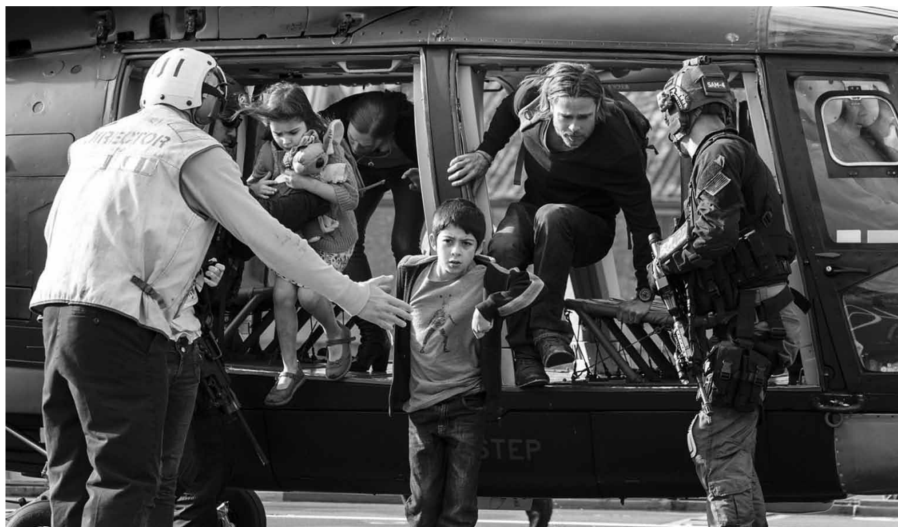
Schon wieder Zombies! Diesmal aber mit Brad Pitt als obersten Draufklopper: „World War Z“, neu in den Kinos.

Die Schauspielerin Robin Wright erlaubt der Firma Miramax sie einzuscannen. Die Hollywood-Studios können sie so für jeden erdenklichen Film nutzen. Sie selbst verschwindet