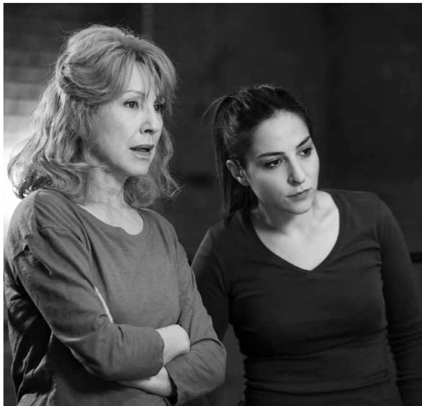
Des femmes qui savent se défendre : « Les reines du ring », nouveau à l'Utopolis.

Tief im Wald, tobt seit ewigen Zeiten ein Krieg, ausgetragen von Schnecken, Vögeln und Insekten, winzigen Waldmenschen und brutalen Kriegern. Die Menschen bekommen nichts von diesen Kämpfen mit. Durch einen Zauber wird Mary Katherine mitten in dieses verborgene Reich transportiert und gerät zwischen die Fronten.