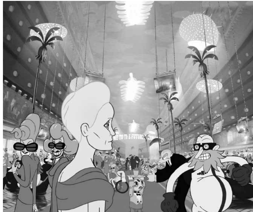
Un congrès pas comme les autres.

La seule chose que « The Congress » a encore en commun avec le film précédent d'Ari Folman - l'excellent « Waltz with Bashir » - est l'utilisation de la technique d'animation. Et encore, si « Waltz with Bashir » a marqué les esprits à cause de sa technique homogène, « The Congress » est un vrai feu d'artifice de styles différents. Pas étonnant, quand on sait qu'il s'agit d'une coproduction entre six pays, dont le Luxembourg. Mais croire que ce film ne porte aucun message politique