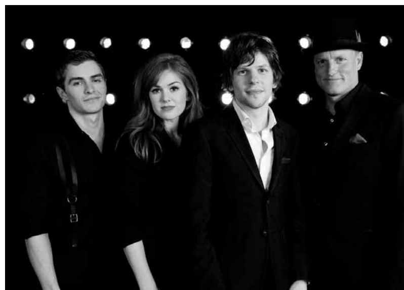
Mark Ruffalo, Isla Fisher, Jesse Eisenberg und Woody Harrelson in „Now You See Me“

F/USA 2013 von Louis Leterrier. Mit Jesse Eisenberg, Woody Harrelson und Isla Fisher. 115'. O.-Ton, fr. + nl. Ut. Ab 12.