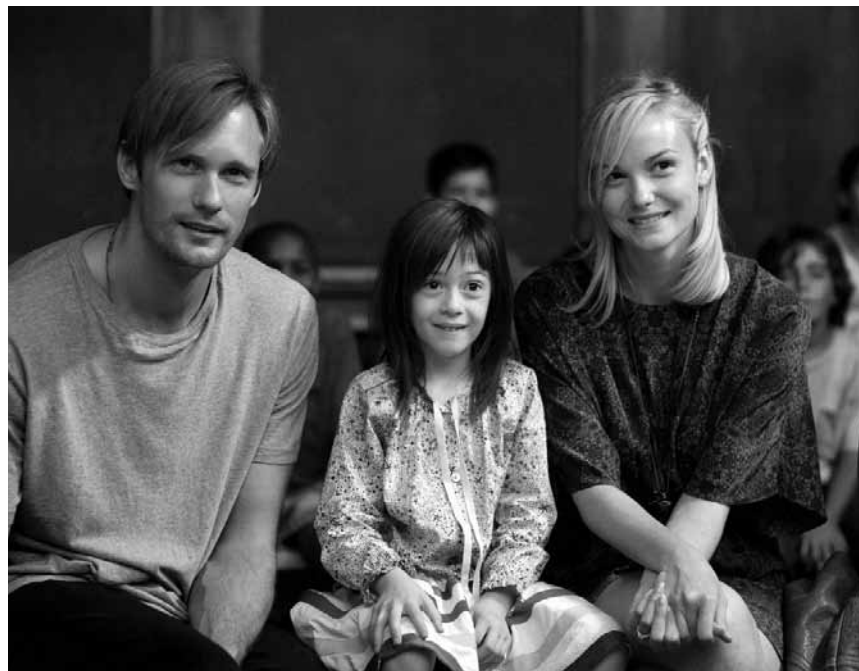
Ein Kind, aufgerieben im Scheidungskrieg zwischen Rockstarmutter und liebendem Vater: „What Maisie knew“. Neu im Utopolis.

Hanni und Nanni erwarten schon voller Vorfreude die im Internat Lindenhof angekündigten englischen Austauschschülerinnen. Durch ein Versehen von Frau Mägerlein entpuppt sich die britische Busladung allerdings als eine männliche Gruppe. Zunächst sind alle ein wenig irritiert und wissen nicht so recht, was sie mit der Situation anfangen sollen. Doch die unverkrampfte Mademoiselle Bertoux hat schon eine Idee.