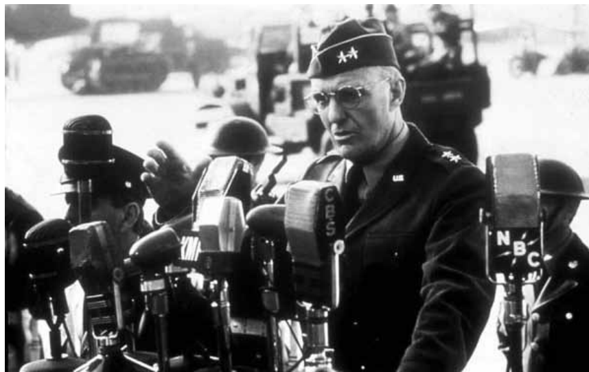
Un des films plus inconnus du « maître » Spielberg : « 1941 », mardi à la Cinémathèque.