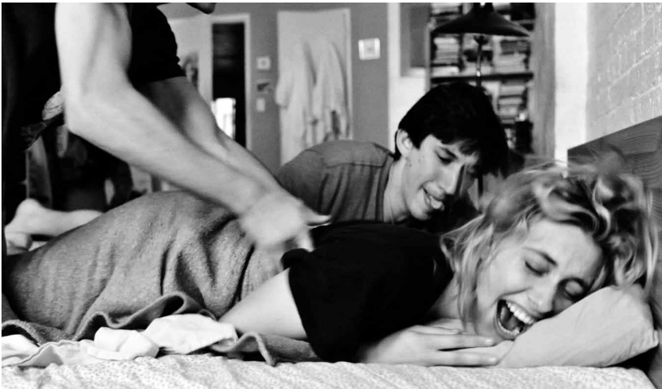
Portrait touchant d'une jeunesse qui ne veut pas finir.