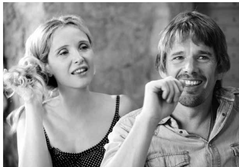
Julie Delpy und Ethan Hawke in „Before Midnight“