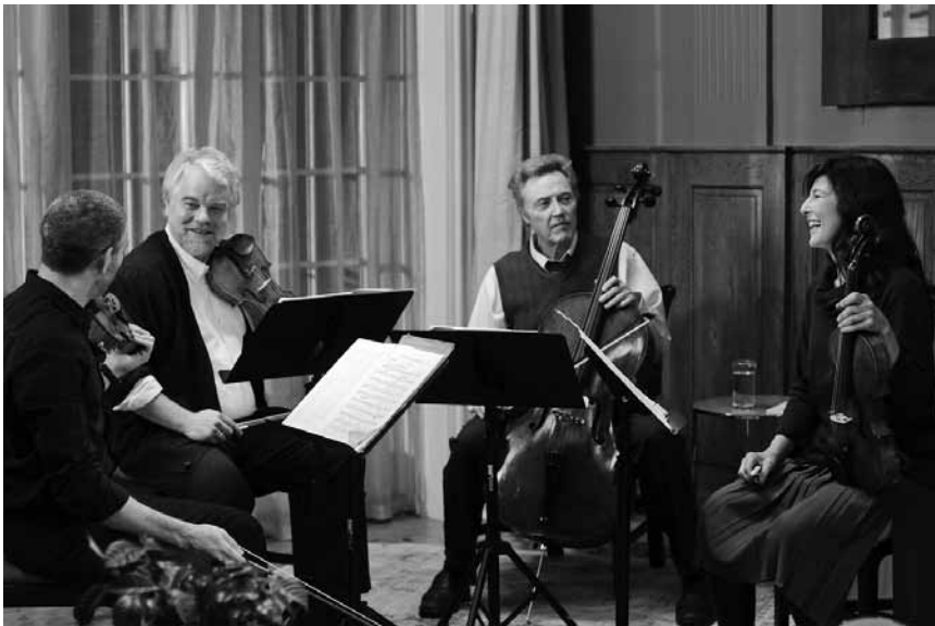
Wenn Christopher Walken zum Cello greift, dann hat das Alter wohl wieder mal unerbittlich zugeschlagen: „A Late Quartet“, neu im Utopia.

nach Paris, weil sie vor ihm den Schalter blockiert und er Gefahr läuft, seinen Termin zu verpassen. Patrizia will zu ihrem Geliebten Jean-Jacques der nach einem Autounfall im Koma liegt. An seinem Bett auf der Intensivstation sitzt aber schon seine Ehefrau, die zunächst nicht daran denkt, die fremde deutsche Frau an ihrer Seite zu dulden.