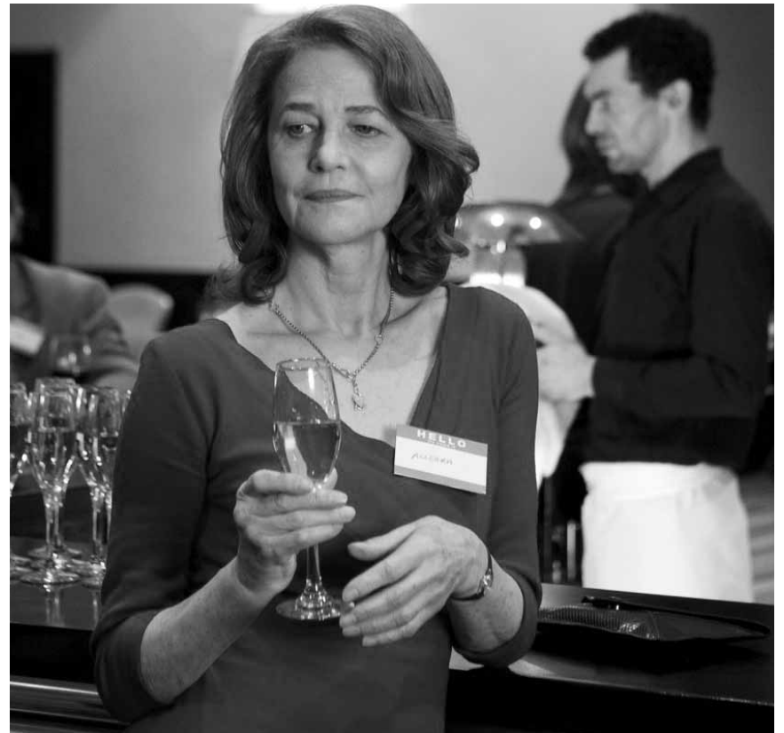
Charlotte Rampling überzeugt als mysteriöse Charmeurin in „I, Anna“. Im Utopia im Rahmen der Summer Follies.