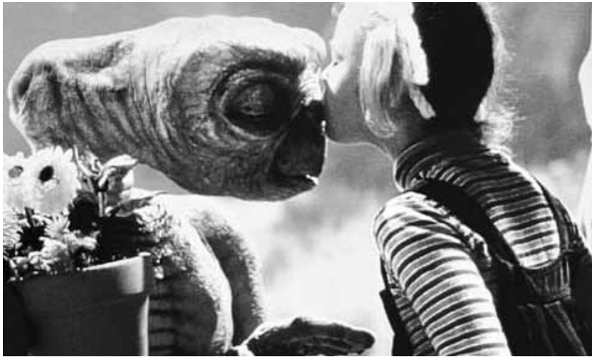
« E.T. » de Steven Spielberg, Open Air à Luxembourg.