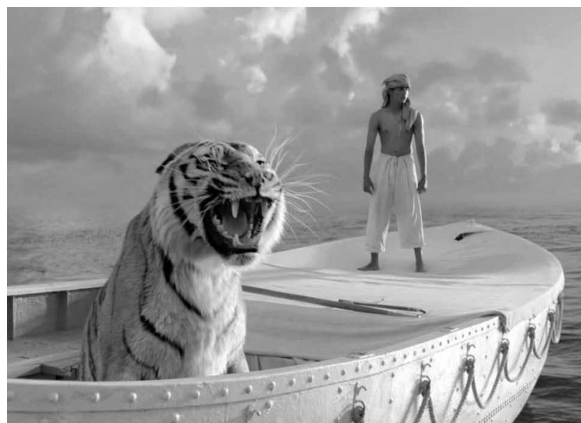
"Life of Pi" von Ang Lee mit Suraj Sharma, Open Air in Luxembourg.

village estival forment un groupe de danse. Pour elle, c'est le début de l'émancipation grâce au dirty dancing, cette danse ultra-sensuelle, et la rencontre avec le professeur de danse.