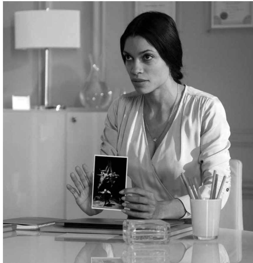
Danny Boyle hat wieder zugeschlagen. Der „Trainspotting“-Regisseur versucht sich in „Trance“ in der Welt der Kunstdiebe. Neu im Utopolis.

Die Schlümpfe bitten ihre menschlichen Freunde um Hilfe, Schlumpfine aus den Klauen Gargamels zu befreien. Dem Zauberer ist es gelungen,