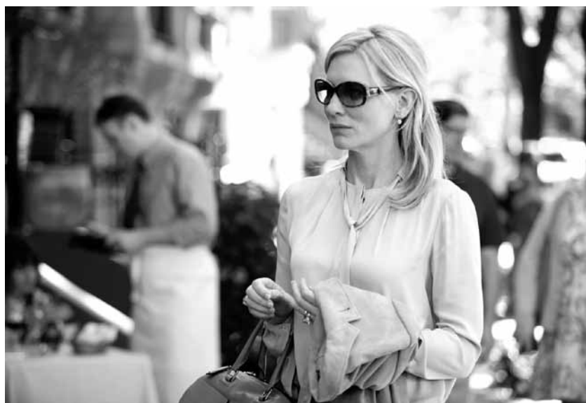
"Blue Jasmine" von Woody Allen, mit Cate Blanchett, Open Air in Düdelingen.

op der Kluuster / am Starlight Open Air Cinema / um lechternacher Séi / am Quartier Delhéicht