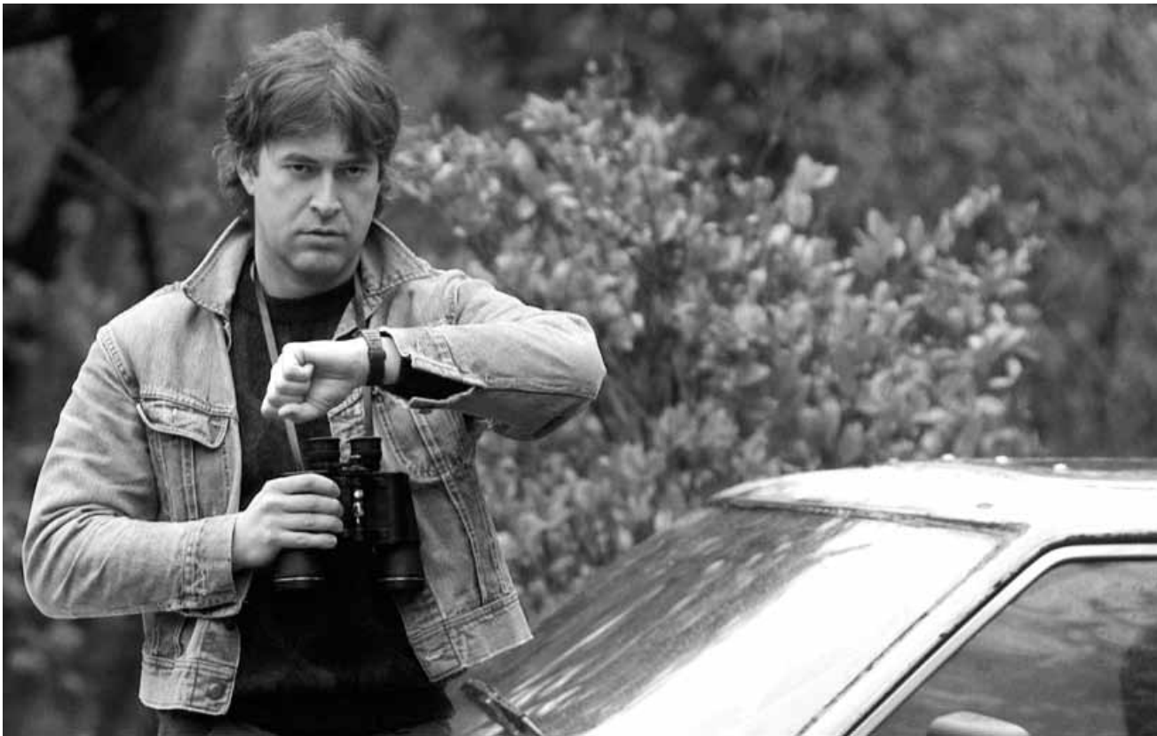
Un coup d'oeil sur la montre de temps en temps peut être crucial quand on voyage dans le temps.