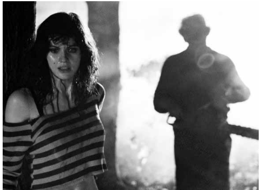
Sommerzeit ist Kettensägenzeit: Bei „Texas Chainsaw“ handelt es sich um das Sequel des allseits beliebten Horrorklassikers. Neu im Utopolis Kirchberg und Belval.