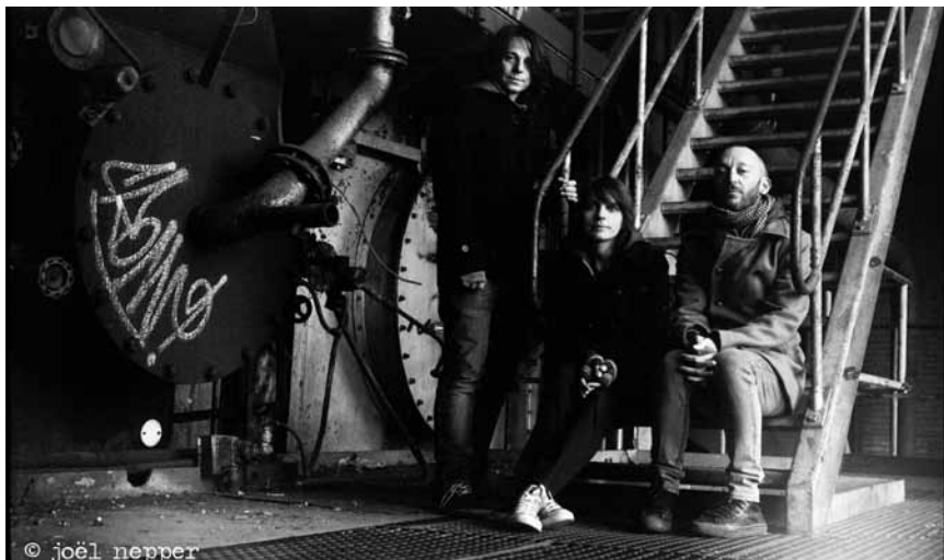
Monophona braucht man dem heimischen Publikum kaum mehr vorzustellen - wer sie noch immer nicht gesehen hat, sollte sich den 15. August im Kalender vormerken, dann ist die Band Support-Act für Cloud Boat im Exit07.

The Kid Colling Cartel , Café Ancien Cinéma, Vianden, 21h. Tel. 26 87 45 32.