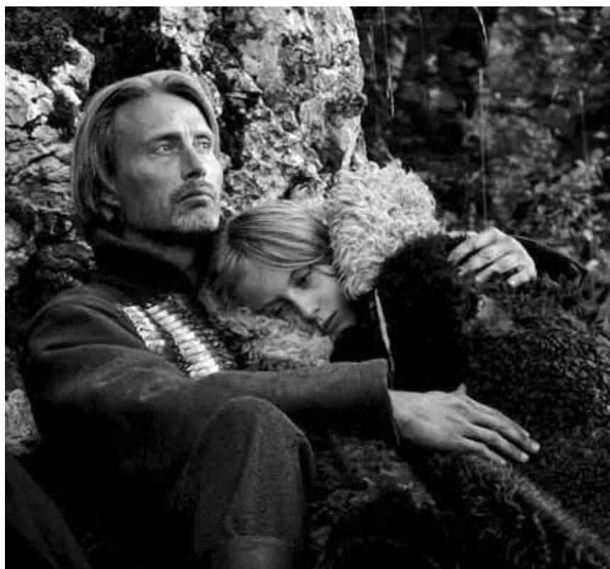
La célèbre histoire du justicier « Michael Kohlhaas », vue cette fois sous un angle français. Nouveau à l'Utopia.

XX Ein harter Film der die ZuschauerInnen zwingt sich mit der Realität des Menschenhandels auseinander zu setzen. (lg)