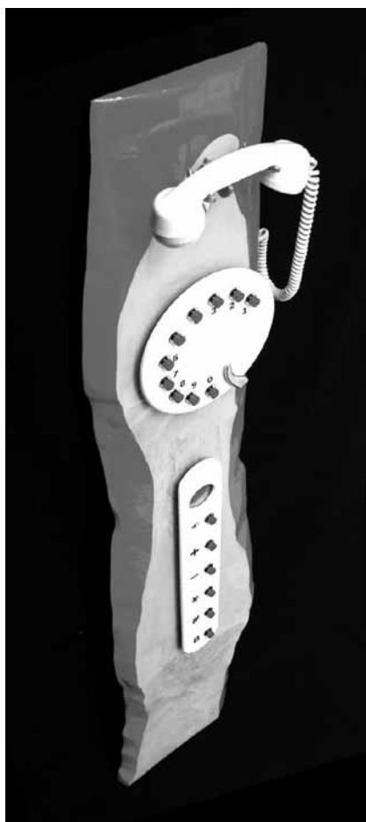
Vestiges d'un temps passé : « Les téléphones importables », encore jusqu'au 13 septembre au Postmusée.

„Das Schweizer Künstlerduo verbalhornt (...) auf intelligente Art unsere Sicht auf den Wald. Eine Ausstellung, deren Besuch sich sogar bei schönstem Sommerwetter lohnt.“ (Jörg Ahrens)