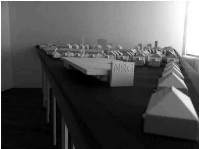
« Futura Bold? Post-City: Considering the Luxembourg Case » - peut faire froid dans le dos.