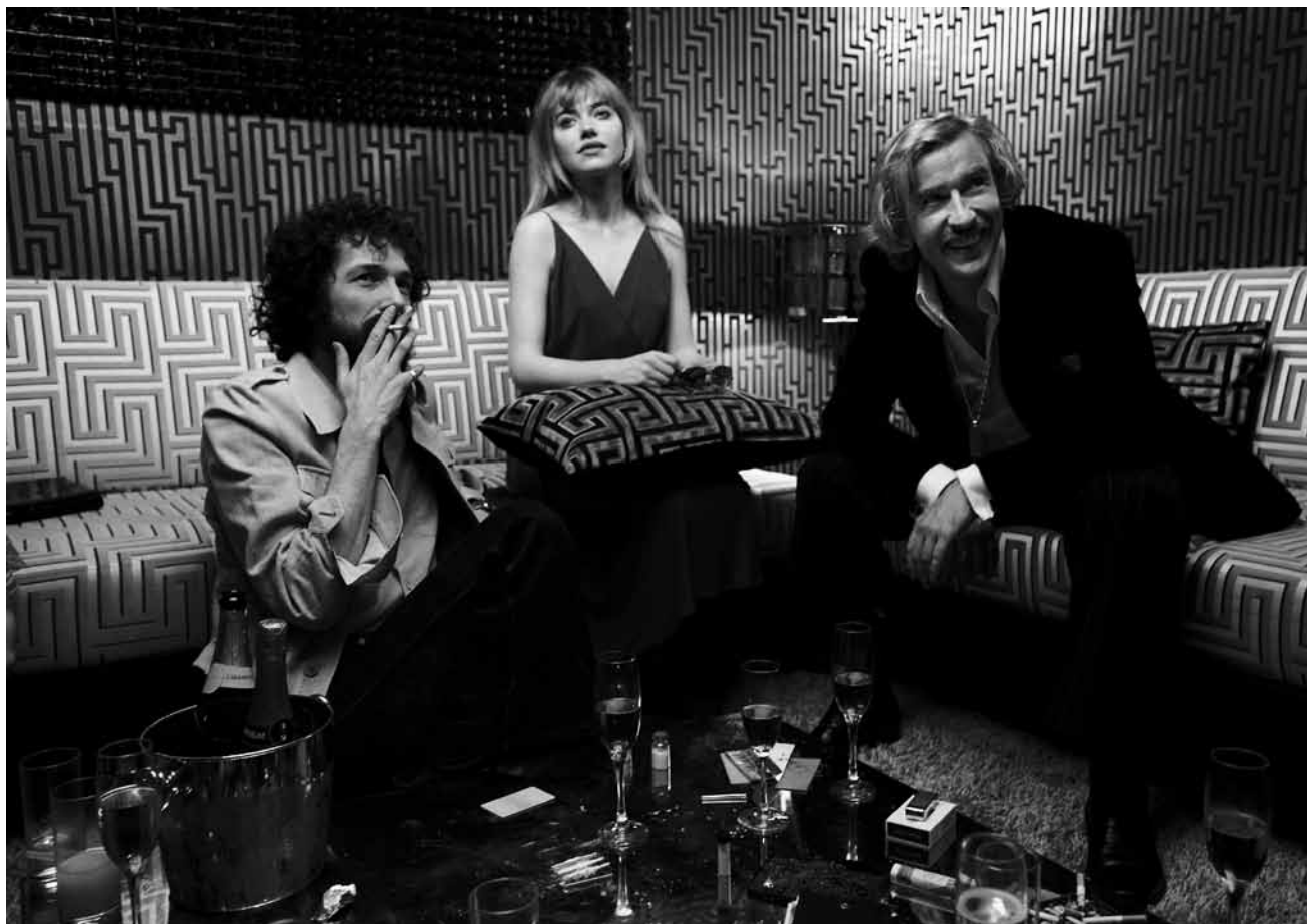
Schöne Frauen sind sein Geschäft. Aber auch ein steinreicher Porno-Baron ist nicht vor Katastrophen gefeit. „The Look of Love“ im Utopia.