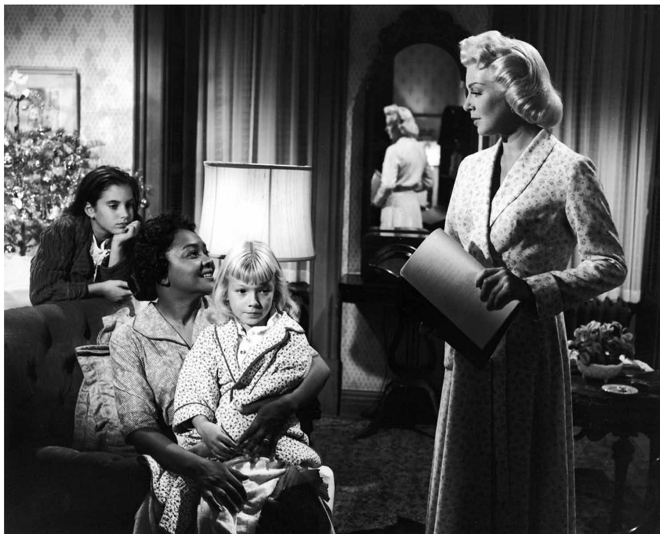
Un des premiers films américains à s'intéresser aux problèmes du racisme : « Imitation of Life », de Douglas Sirk, jeudi à la Cinémathèque.

*** Sehenswert und berührend - wenn auch manchmal schwer zu ertragen. (lc)