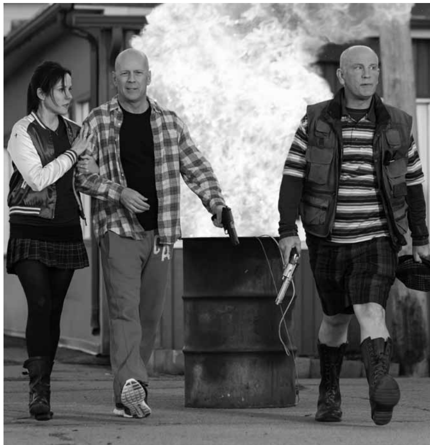
Red reloaded - Bruce Willis und Konsorten sind sich auch im zweiten Teil für nichts zu schade. Red 2 neu im Utopolis.

Eine längst überfällige Sozialstudie und ein Spiegelbild der Klassen-Verhältnisse in den USA nach der Finanzkrise. Cate Blanchett hätte für ihre Rolle den Oskar verdient. (avt)