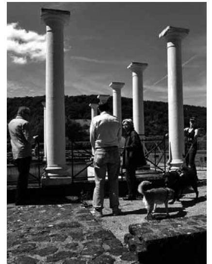
Kultur genießen mit den Vierbeinern: Das ist am 8. September in der Villa Romaine in Echternach möglich bei der „Mupp on Tour“.

Uli Masuth , Kabarett, Tufa, Kleiner Saal, Trier (D), 20h. Tel. 0049 651 7 18 24 12.