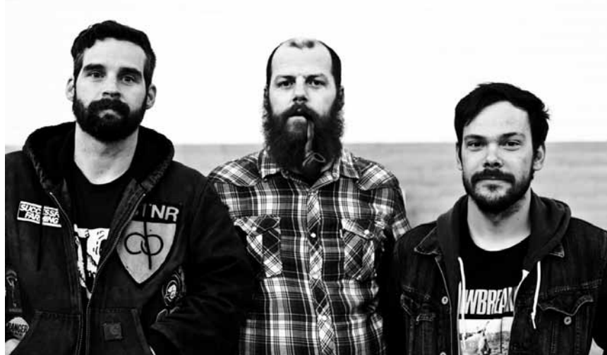
Quelque part entre hip-hop et rock indé, l'ovni musical et grassroots « Listener » fera un petit stop-over à l'Entrepôt d'Arlon le 4 septembre. En avant-programme : Beneath the Seas.

Listener + Beneath the Seas, L'Entrepôt (2, rue Zénobe Gramme), Arlon (B) , 21h. www.entrepotarlon.be