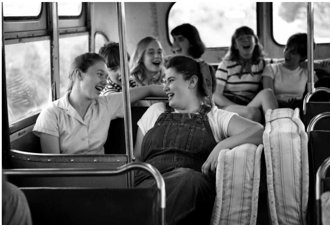
Après les salles de classe françaises, Laurent Cantet s'occupe des gangs de filles new-yorkaises : « Foxfire - Confessions of a Girl Gang », nouveau à l'Utopia, dans le cadre des Summer Follies.