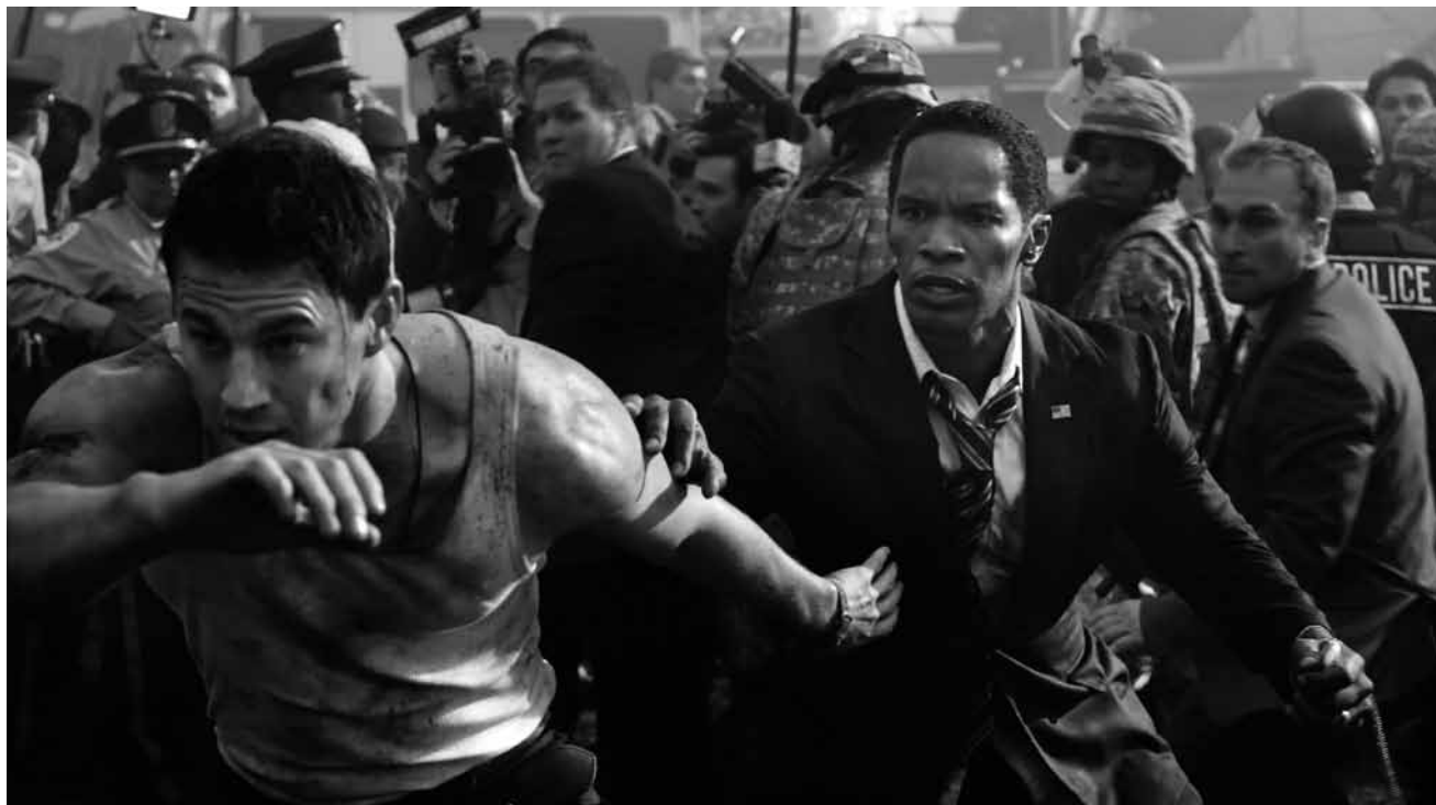
In „White House Down“ ist der US-Präsident mal wieder in höchster Gefahr - neu im Utopolis Belval und Kirchberg.

Starlight, 3D: Fr. 16h30, Di. 14h30 (dt. Fass.).