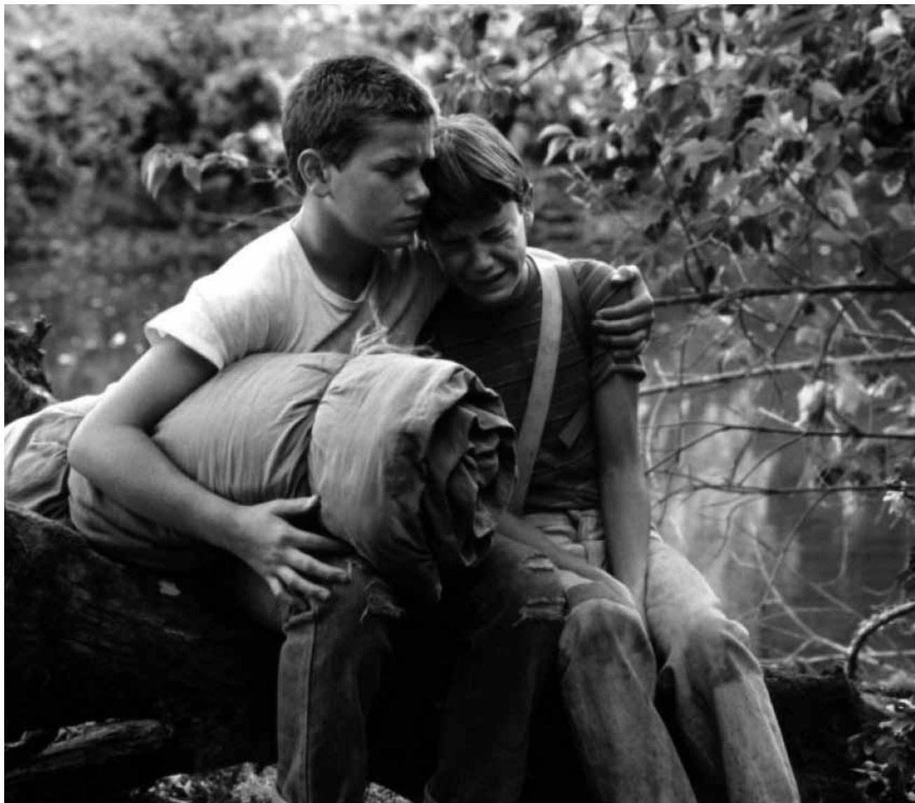
Der Film, der River Phoenix für viele unsterblich gemacht hat: Stand by Me am 12. September in der Cinémathèque.