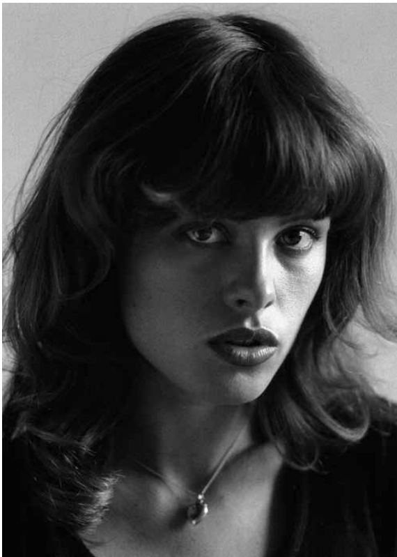
Uschi Obermeier - Munich 1973