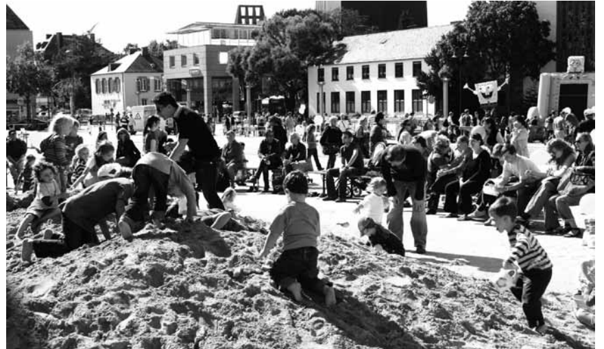
„Trier spielt“ - das ist der Tag, an dem die Stadt sich in einen riesigen Spielplatz verwandelt - am 14. September in der ganzen Innenstadt.