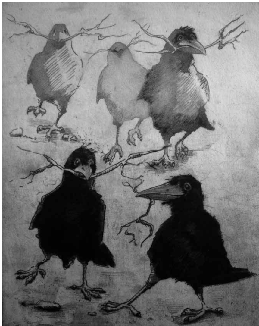
Quand les maîtres corbeaux retournent sur les arbres se percher, c'est « L'Automne de la gravure » à l'Espace Beau Site d'Arlon - avec entre autres les travaux de Marie-Pierre Speltz -, du 14 septembre au 14 octobre.