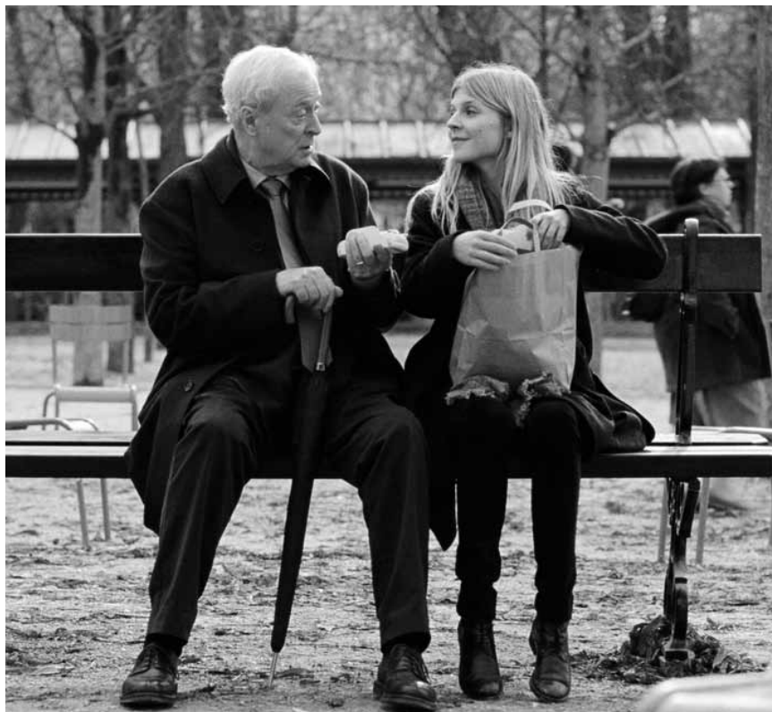
Michael Caine blüht im hohen Alter noch einmal so richtig auf, in „Mr Morgan's Last Love“. Neu in Utopia.

und zurücktreten will. Dies wirkt sich auf das Leben aller vier Musiker aus. Der zweite Violinist Robert, will unter einem neuen Cellisten häufiger die erste Geige spielen können. Davon wollen der erste Violonist Daniel und Violaspielerin Jules, die auch Roberts Ehefrau ist, jedoch nichts hören. XX Fachkundige Schauspieler zeigen, wie hochqualifizierte Musiker sich nicht nur musikalisch sehr nahe kommen, sondern dass sie sich auch persönlich nicht aus dem Weg gehen können. (lg)