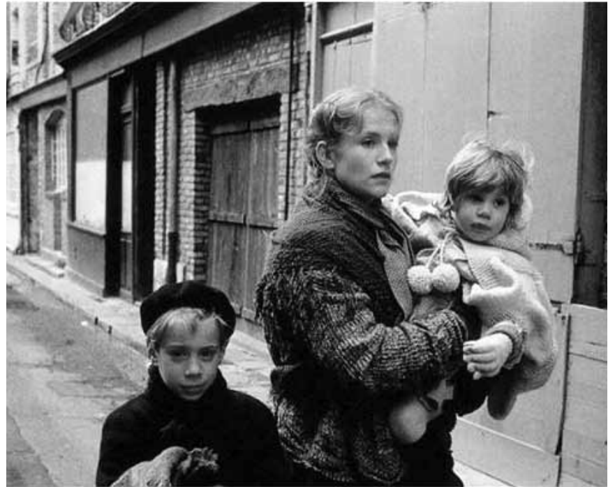
Le sort d'une femme sous l'Occupation, revu par le maître de la Nouvelle Vague : « Une affaire de femmes » de Claude Chabrol, mardi à la Cinémathèque.