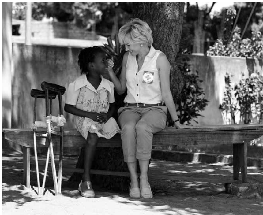
Après tous les films de zombies, encore une résurrection : « Diana » d'Oliver Hirschbiegel avec Naomi Watts. Ladies' night à l'Utopolis.