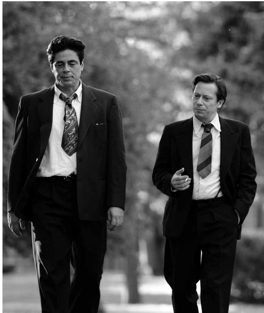
Dans « Jimmy P. », un Indien Blackfoot doit exorciser ses démons avec l'aide d'un psychiatre - nouveau à l'Utopia.