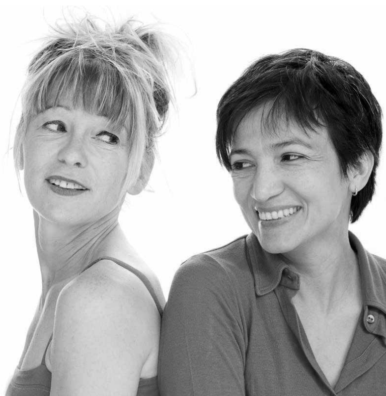
Quand la comédie croise la révolution c'est « La nuit de la Cucaracha », à partir du 18 septembre au théâtre du Centaure.

Das falsche Spiegelbild , Lesung mit Valeska Réon, Kaiserhof (Mainzer