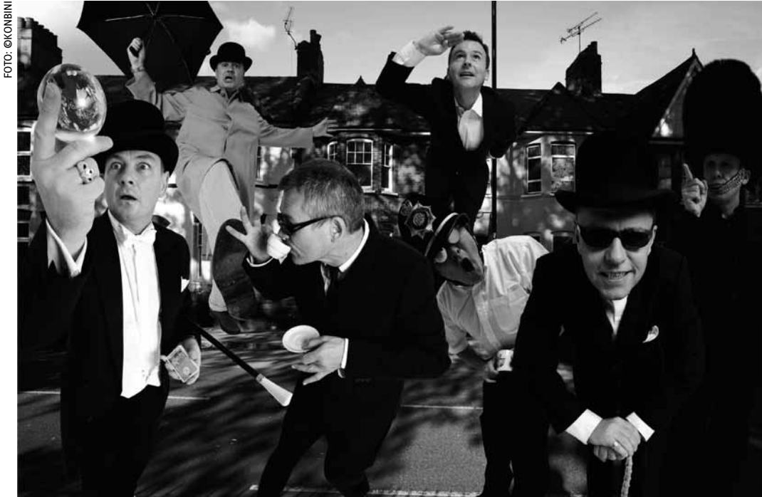
Madness haben die positive Energie mit Löffeln gefressen.