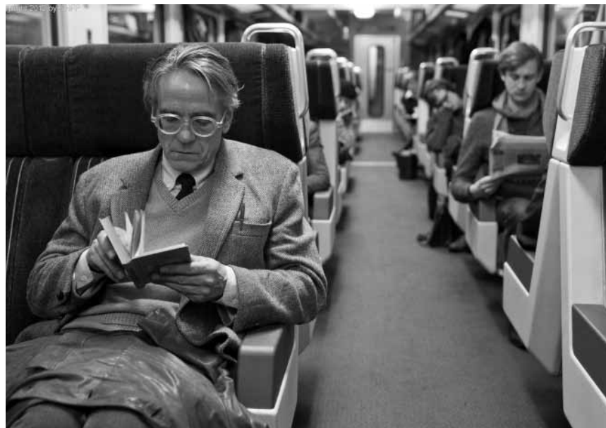
Das festgefahrene Leben des Professor Gregorius entgleist in „Night Train to Lisbon“, dem neuen Film von Regisseur Bille August. Vorpremiere am Freitag im Utopia.

Le portrait d'une jeune fille de 17 ans en quatre saisons et quatre chansons.