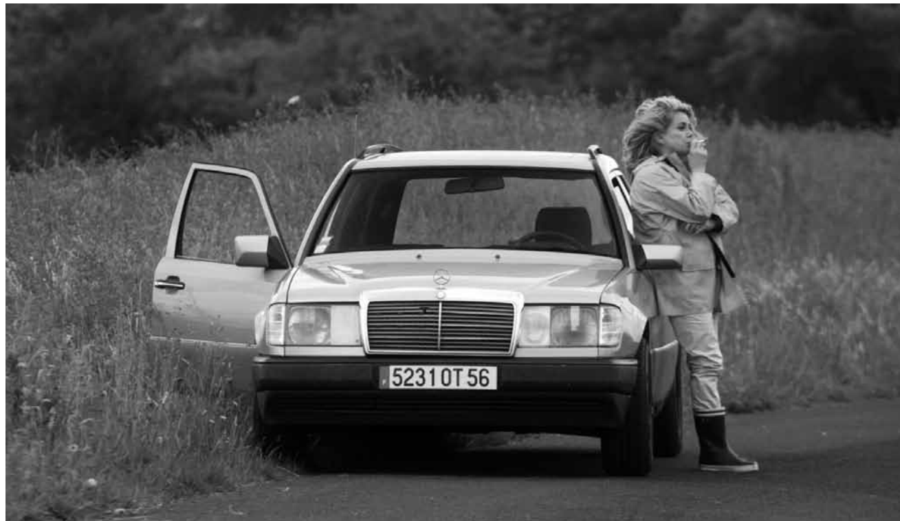
La Deneuve en fugueuse - juste que cette fois, elle essaie d'échapper à la retraite anticipée. « Elle s'en va », nouveau à l'Utopia.

Maria et José Ribeiro vivent depuis bientôt trente ans au rez-de-chaussée d'un bel immeuble haussmannien, dans leur petite loge. Ce couple