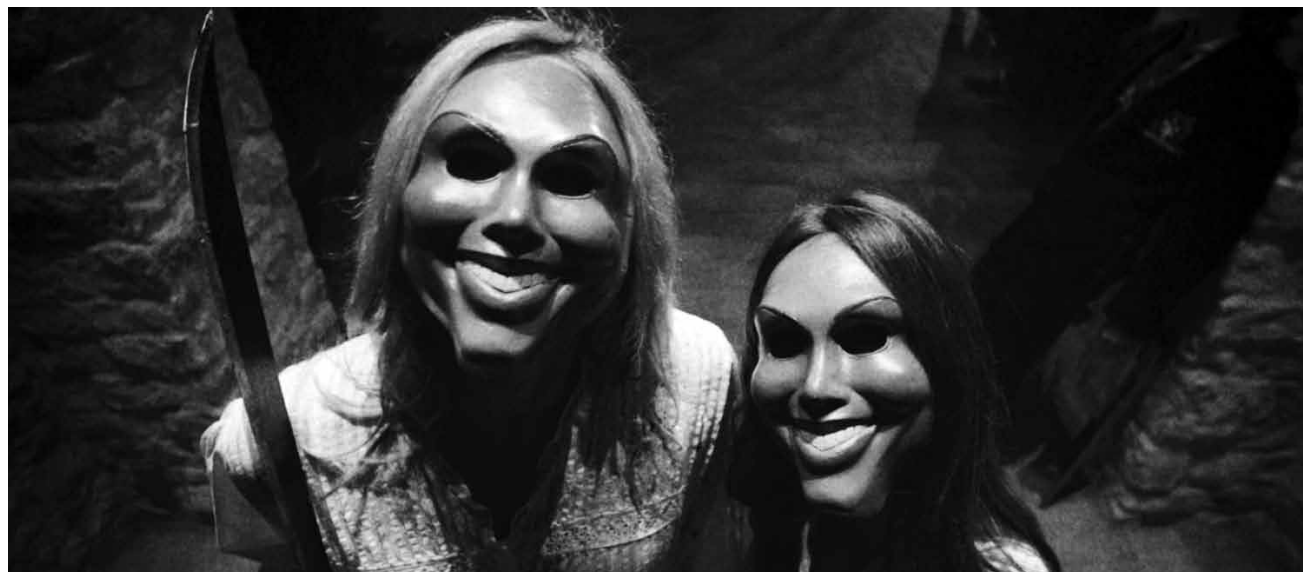
„The Purge“ ist ein weiteres amerikanisches Schreckensszenario: Einmal im Jahr sind für 12 Stunden sämtliche Verbrechen legal. Neu im Utopolis Kirchberg.

David Burke, ein kleiner, lokaler Drogendealer, wird von drei angriffslustigen Punks um Geld und Stoff erleichtert. Jetzt steckt er ziemlich tief in der Patsche, da er nun bei seinem Zulieferer hohe Schulden hat, ihm aber das Geld fehlt, diese zu begleichen. Um die nötigen Scheinchen zu verdienen soll David die nächste große Marihuana-Lieferung über die mexikanische Grenze in die USA schmuggeln. Siehe Filmflop Seite 9.