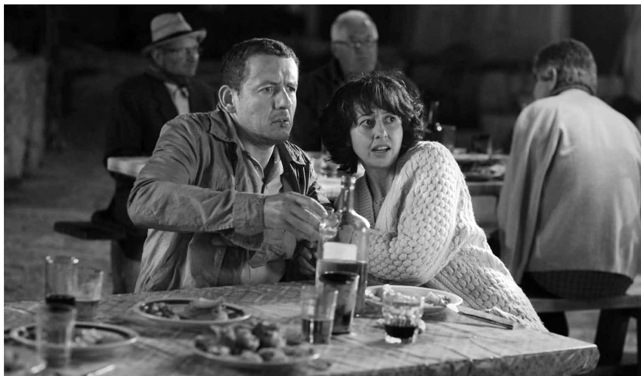
L'éruption en Islande réunit un couple français qui ne voulait que se rendre en Grèce. « Eyjafjallajökull - Le volcan », avant-première vendredi à l'Utopolis Belval.

Pour les voyageurs du monde entier, l'éruption du volcan islandais Eyjafjallajökull est un coup dur. Pour