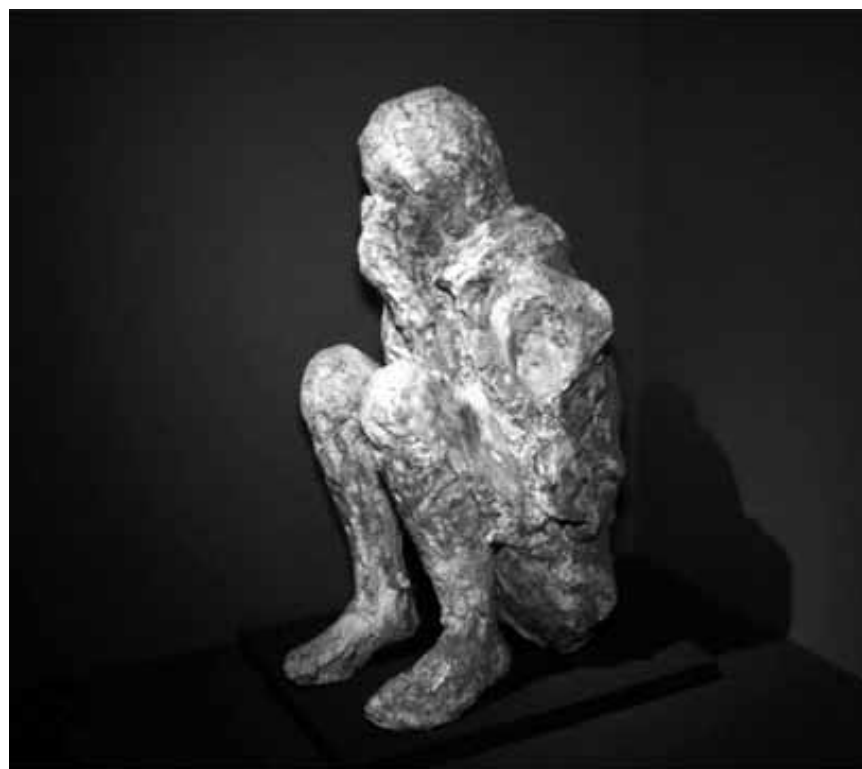
"Pompei from the British Museum" shows exclusive insights of the Museum's show about the life and - rather painful - death of the inhabitants of the antique towns of Pompei and Herculaneum. Extra shows on Tuesday at Utopolis Kirchberg und Belval.