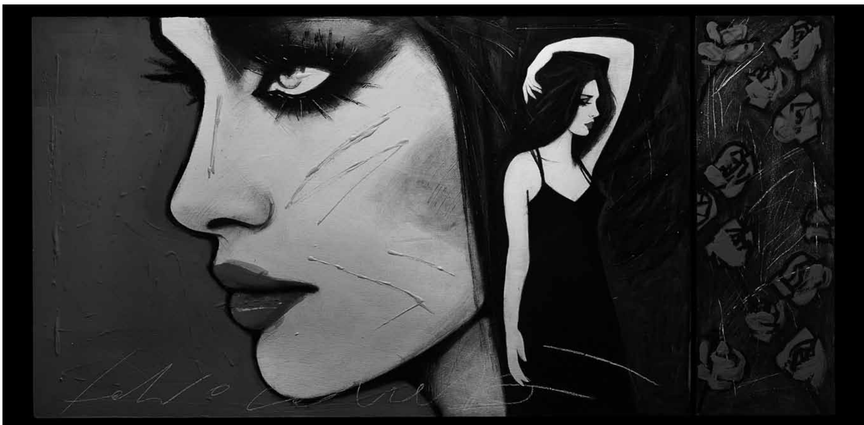
Le peintre italien Fabio Calvetti semble avoir baigné dans l'art de la bande dessinée - ses oeuvres, tout comme les sculptures de Renaud Matgen, sont exposées à la galerie d'art Schortgen à Luxembourg-Ville du 21 septembre.

Visites guidées les ve. 18h + 19h15 (F) et di. 15h + 16h15 (L/D).