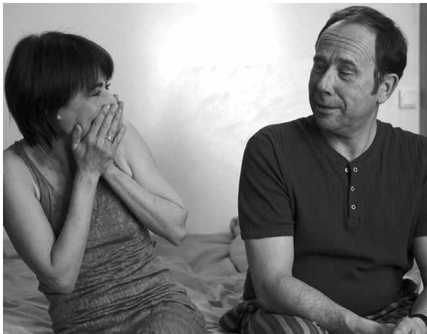
Que'est-ce qui reste, quand le monde s'effondre ? Dans « La tendresse » un couple se retrouve sur les traces de ses sentiments. Nouveau à l'Utopia.

Im Internet gerät Mark an die attraktive und mysteriöse Rachel. Als diese plötzlich nicht mehr auftaucht, will Mark der Angelegenheit auf den Grund gehen und gerät dabei in eine Geschichte hinein, die sein gewöhnliches Leben vollkommen aus den Fugen geraten lässt.