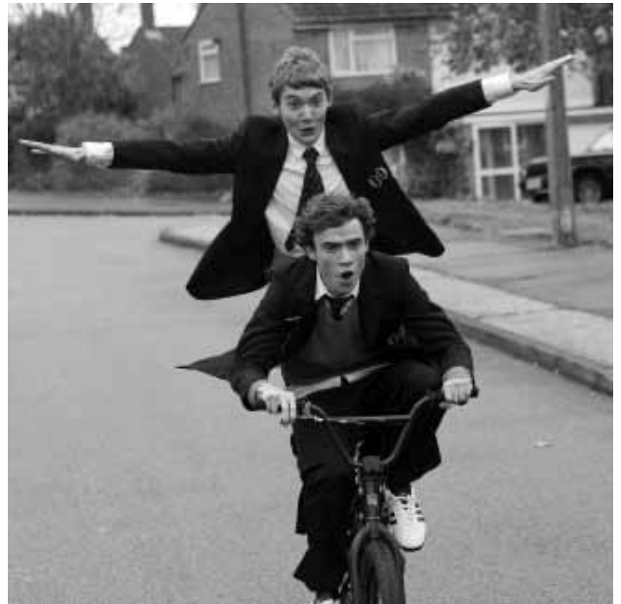
Der Rausch im wahren Leben fühlt sich eben doch noch besser an als der virtuelle Kick: „Uwantme2killhim?“, im Utopia im Rahmen des „British and Irish Film Festival“.