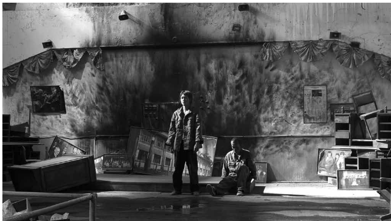
Les problèmes sociaux d'une population marginalisée se trouvent au centre de l'oeuvre de l'enfant terrible de la scène artistique taiwanaise Chen Chieh-Jen qui expose ses dernières oeuvres au Musée d'Art Moderne Grand-Duc Jean.

„Die Bilder zeugen von der Kreativität junger Menschen die an den Initiativen des Capel teilnehmen. Es lohnt sich demnach langsameren Schrittes durch den Tunnel zu gehen um den Wert solcher Initiativen zu erkennen. (Stephanie Majerus)