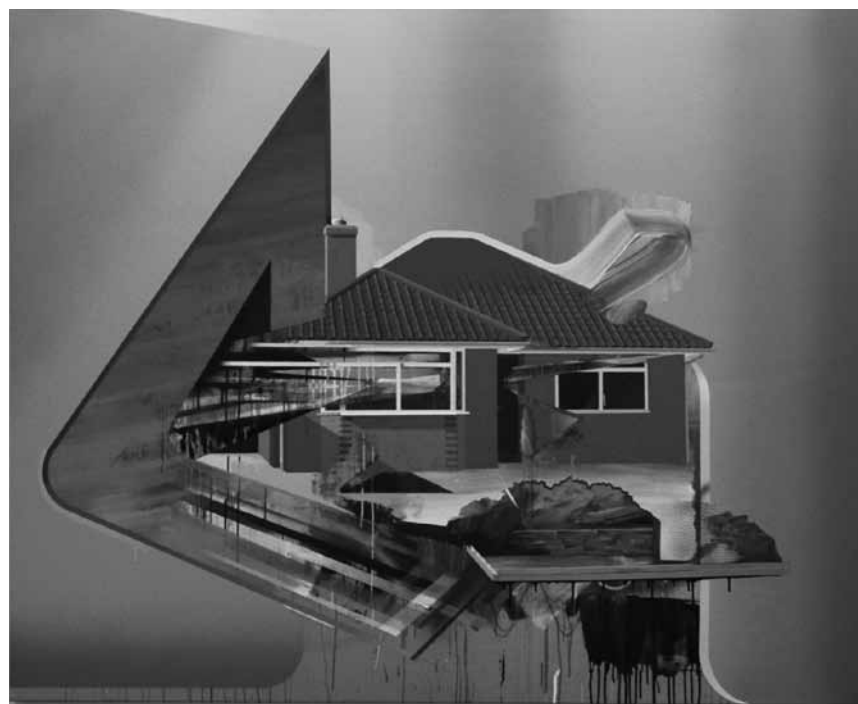
Une salle en quatre dimensions ? La première exposition de l'artiste danois Ivan Anderson à la galerie Nosbaum & Reding met en cause la perception de l'espace.